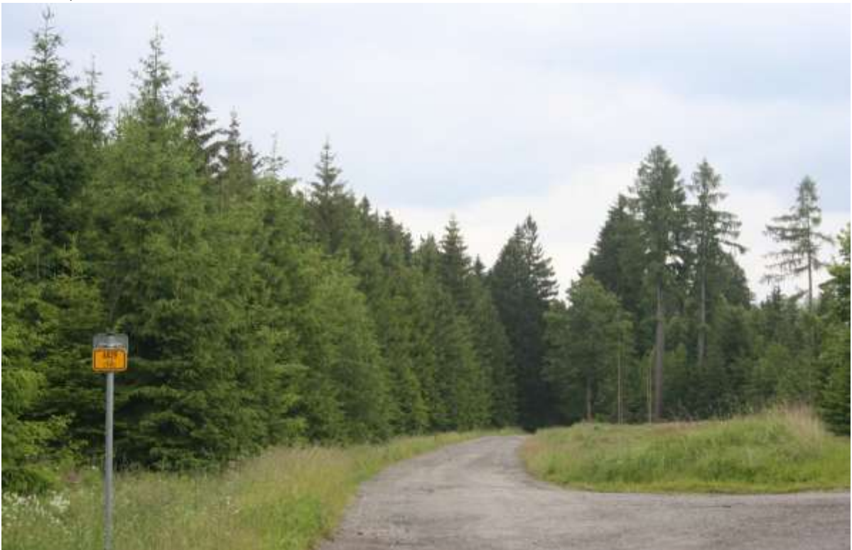
De prachtige bossen, met fietsroutes, ten noorden van Šternberk.