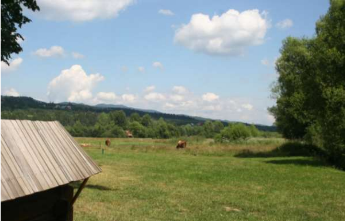
Vergezicht bij de kerk van Debno.