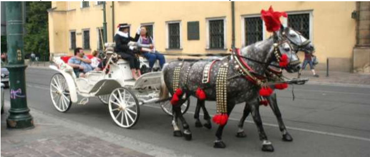
Koets met paarden voor het centrum voor Paus Johannes Paulus II.