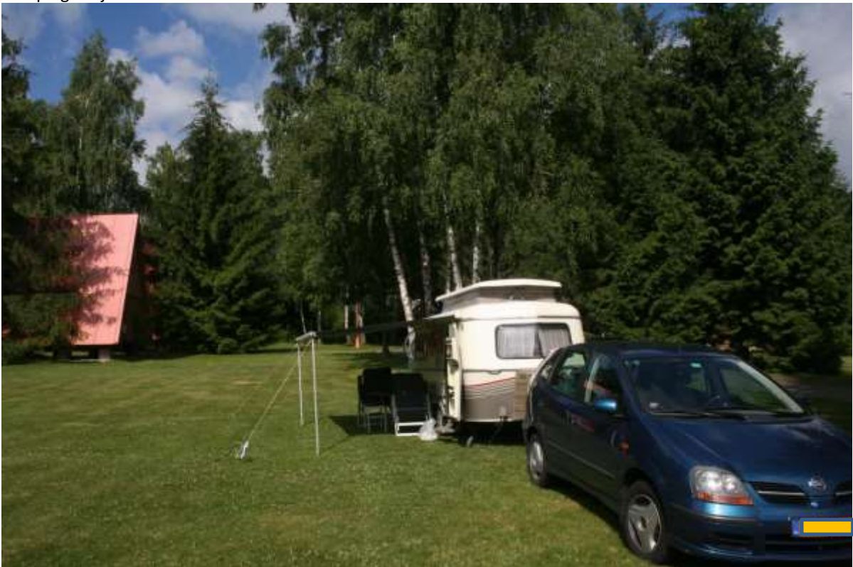
Rustiek kamperen in Martin.