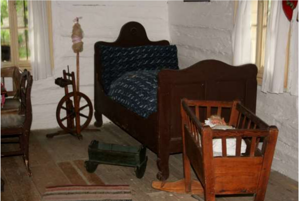
Huiskamer in het museum.