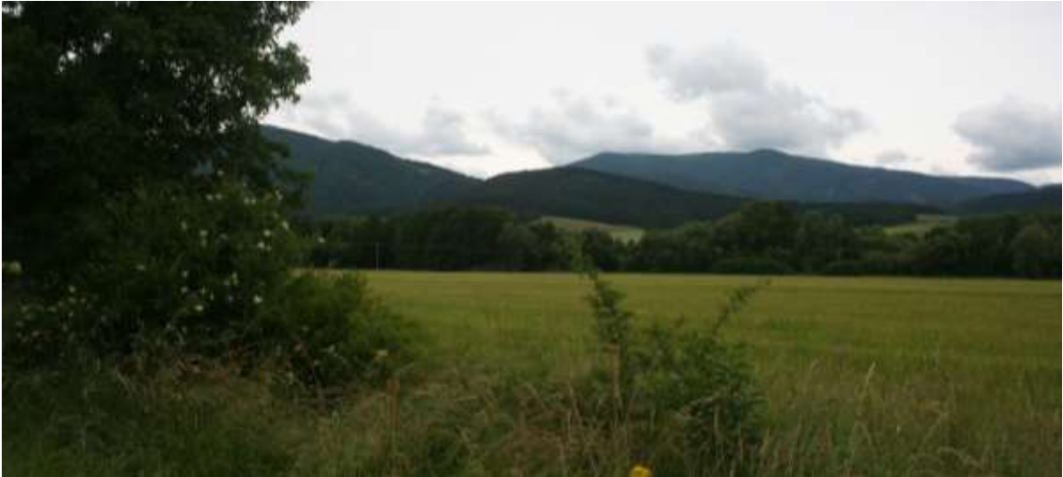
Gezicht op Lage Tatra, noordkant.