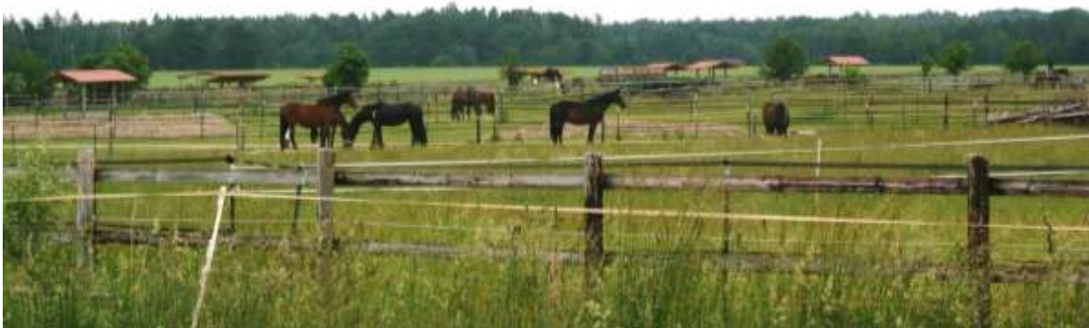
Paarden als buren van de camping.