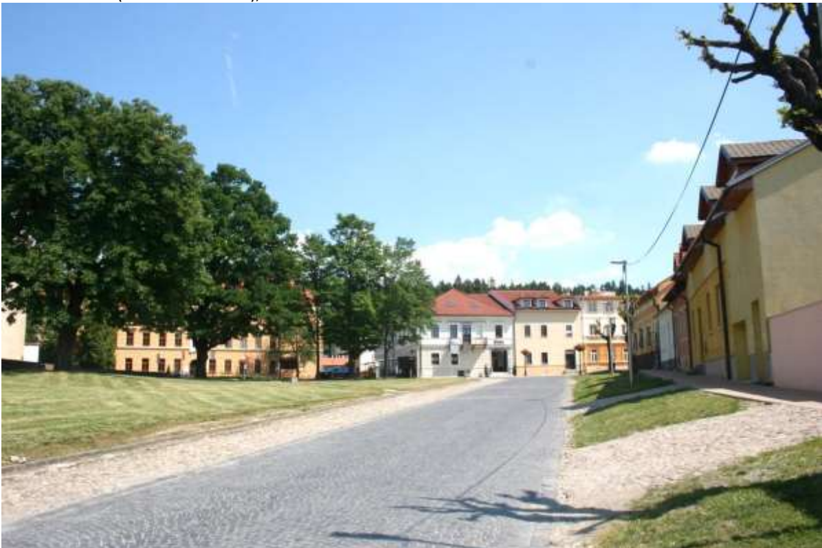
Plein voor het kasteel.