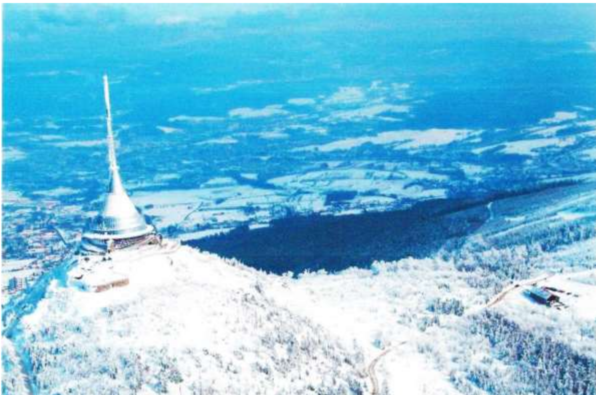
De berg Ještěd die domineert de omgeving van de stad.