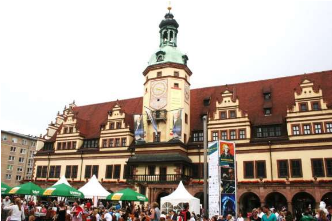
Oude stadhuis aan de Markt met vlaggen waarop afbeeldingen van J.S. Bach staan.

Zaterdag 13 juni 2015 Clausthal-Zellerfeld – Leipzig.