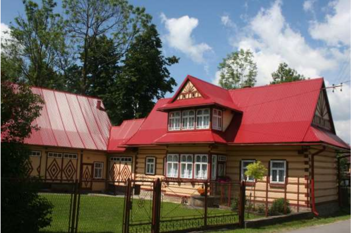
Huis ergens onderweg naar Chochołowska.