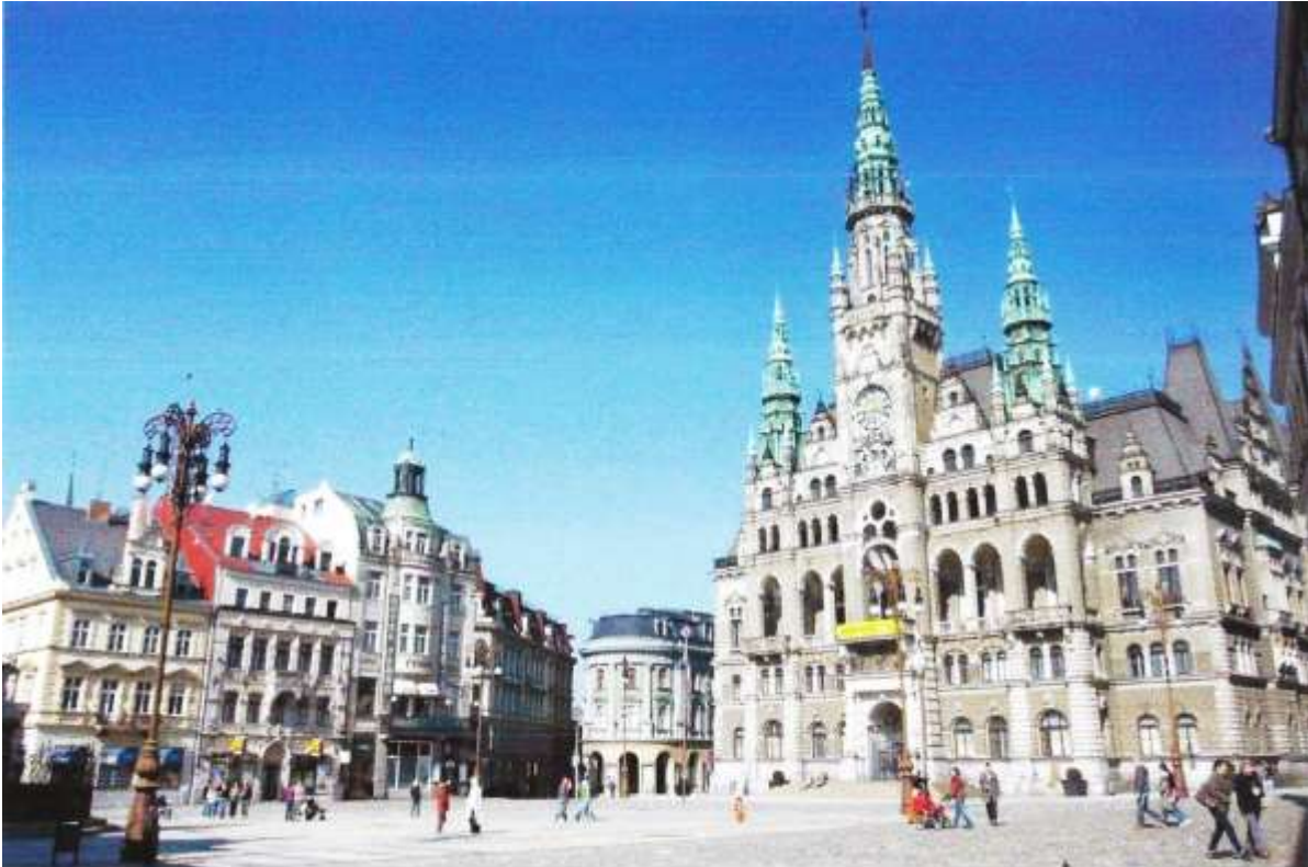
Het stadhuis van Liberec.