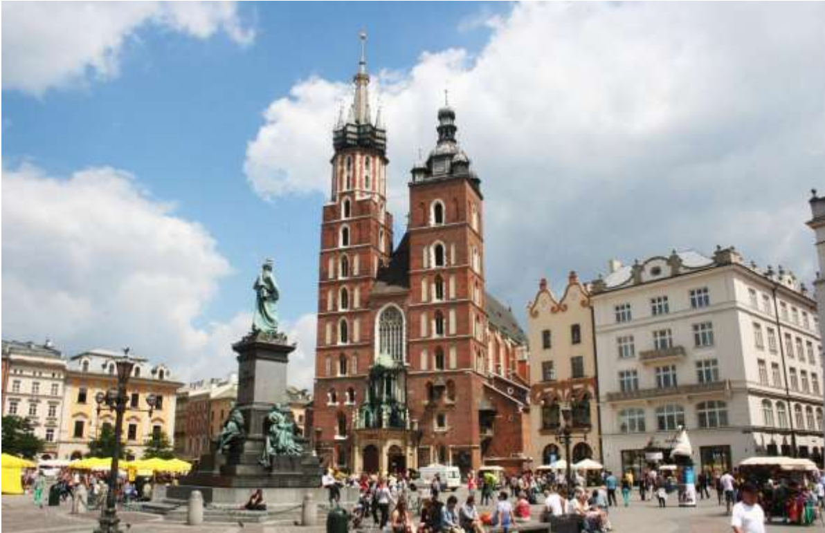
De beroemde de gotische Kerk van de Hemelvaart van de Heilige Maagd Maria.