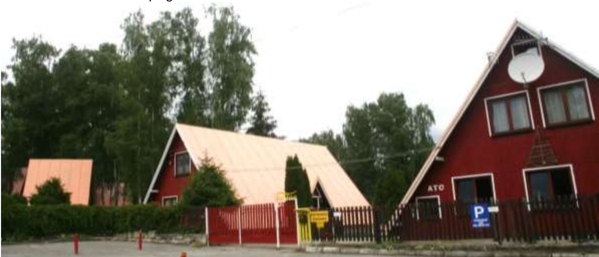
Camping: ATC Turiec, Martin.