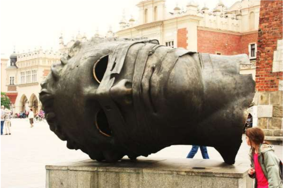
Het beeld: Eros Bendato , gemaakt in Brazilië in 1999 door: Igor Mitoraj.