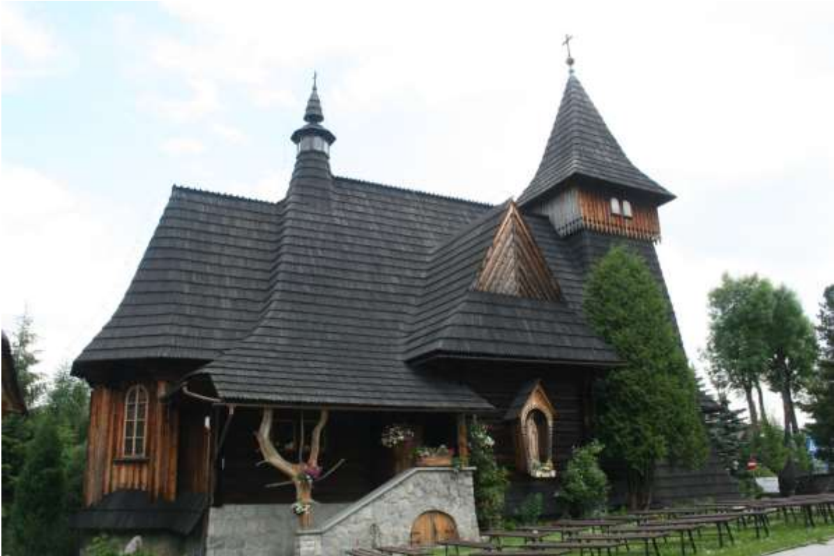
De kerk van Bukowina Tartz.