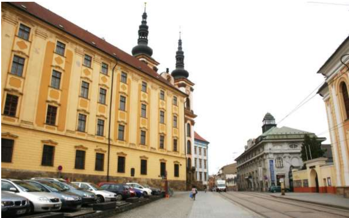
Een van de gebouwen van de Universiteit.