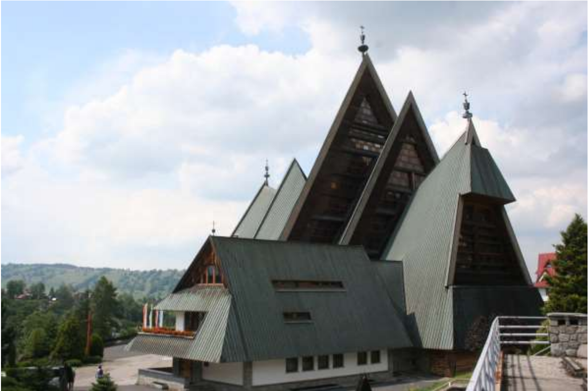
Kerk met de vele driehoeken aan de straat: Piszczory 13, Zakopane.