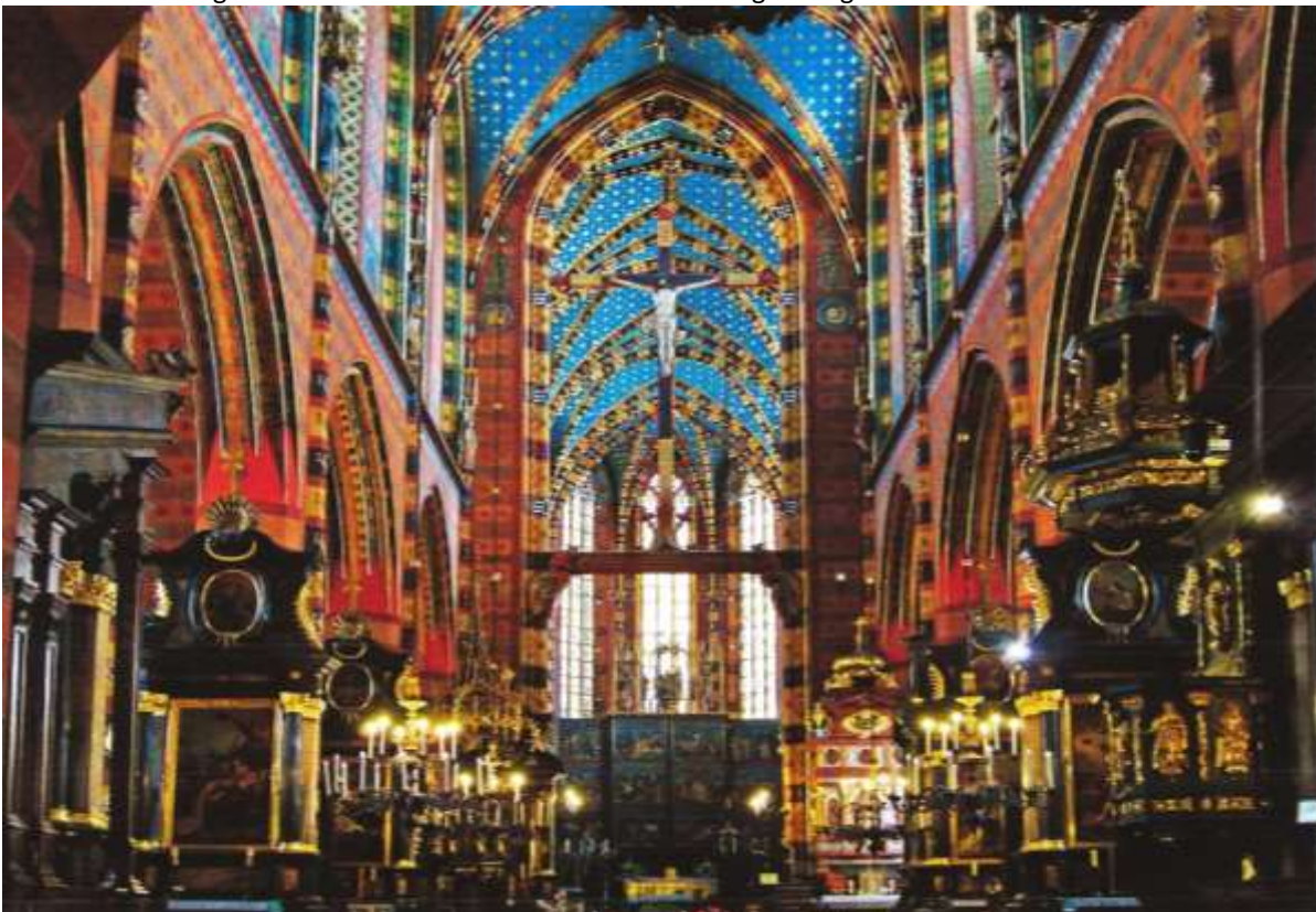
Interieur: Maria-Hemelvaartkerk, Krakau.