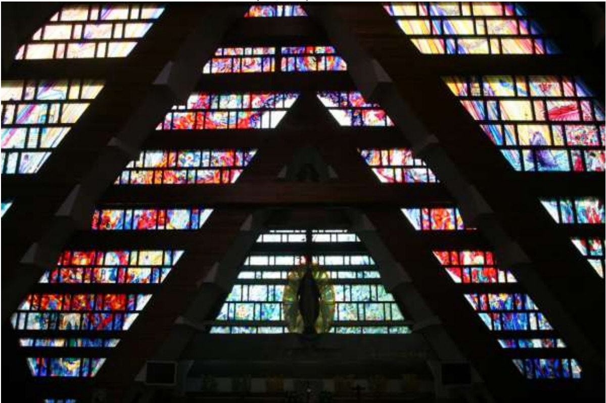
Midden onder het Hoofdaltaar, fragment van de achterwand van deze kerk.