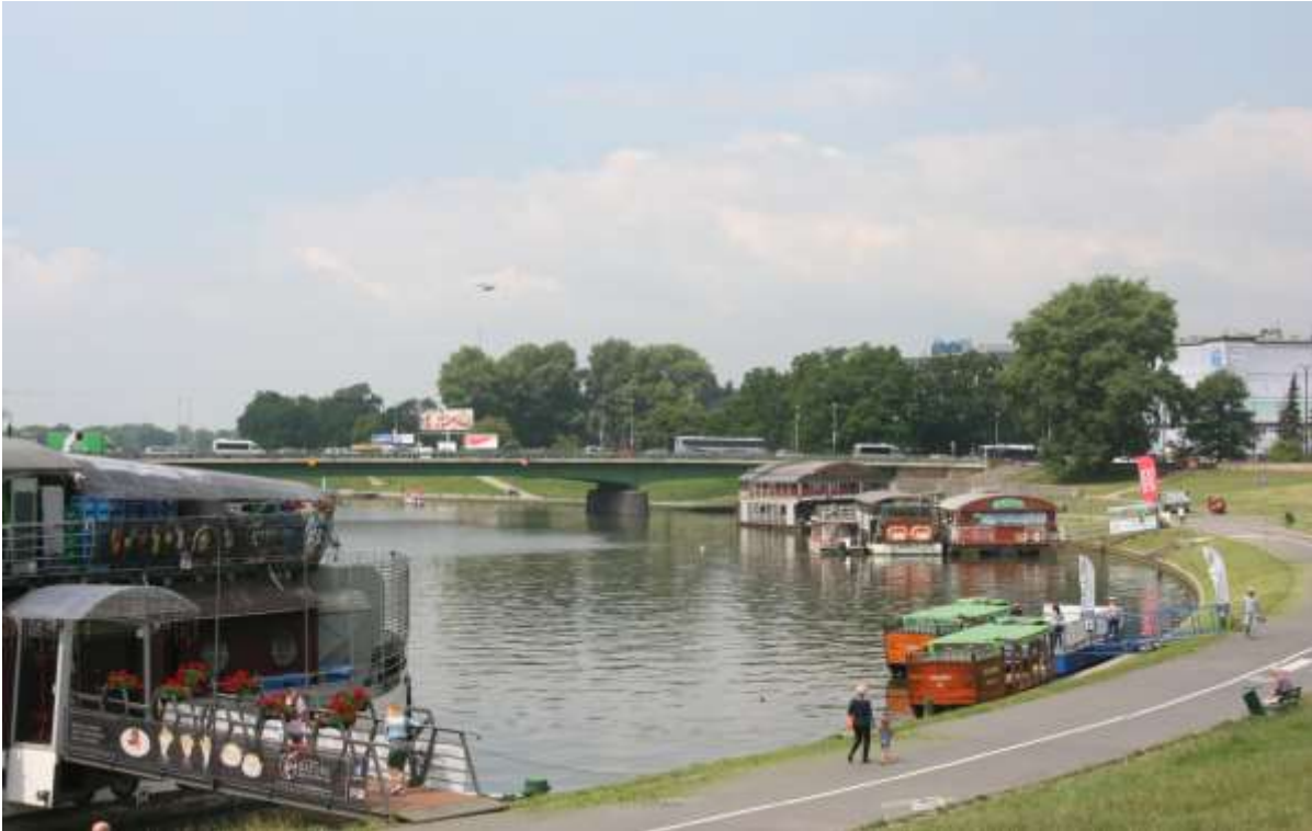
De rivier Wavel.