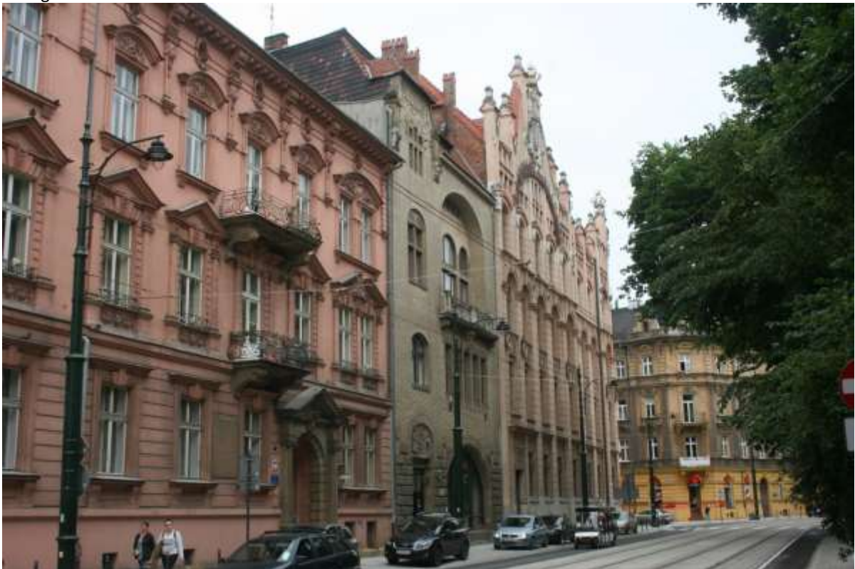
Een straat in het oosten van het centrum.