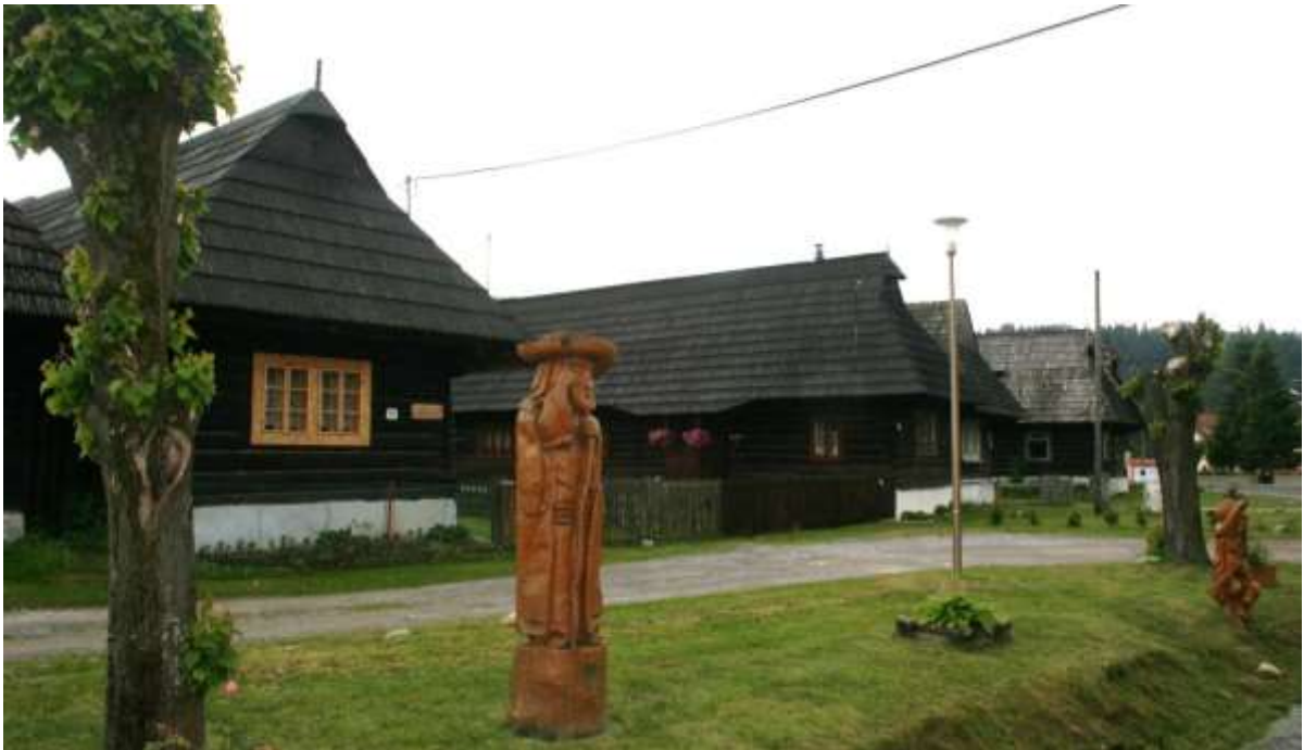
Het dorpje Podbiel, lijkt wel een openluchtmuseum te zijn.