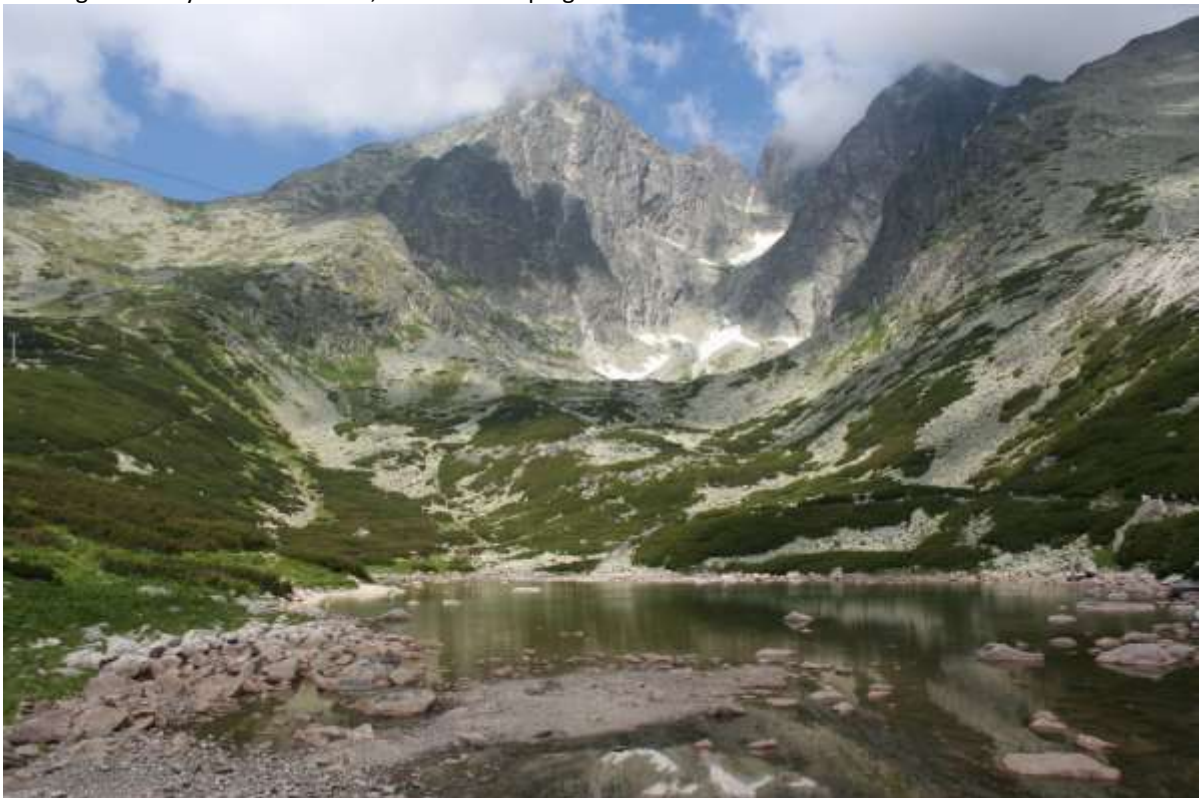
De berg Lomnický štít vanaf 1768 meter, met de mooie kleureffecten.