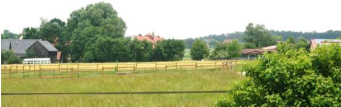
Omgeving van de camping.