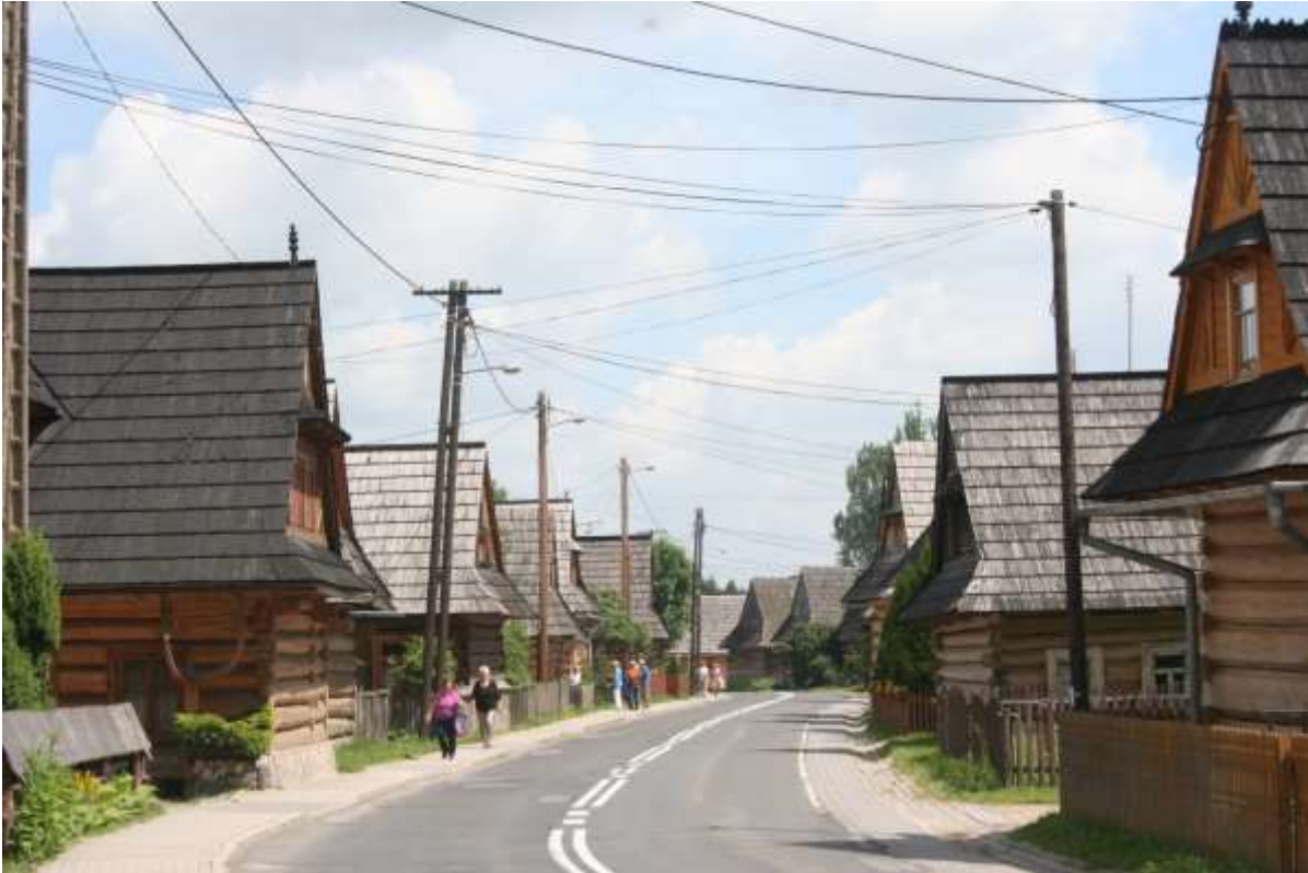
Een straat in Chochołowska.