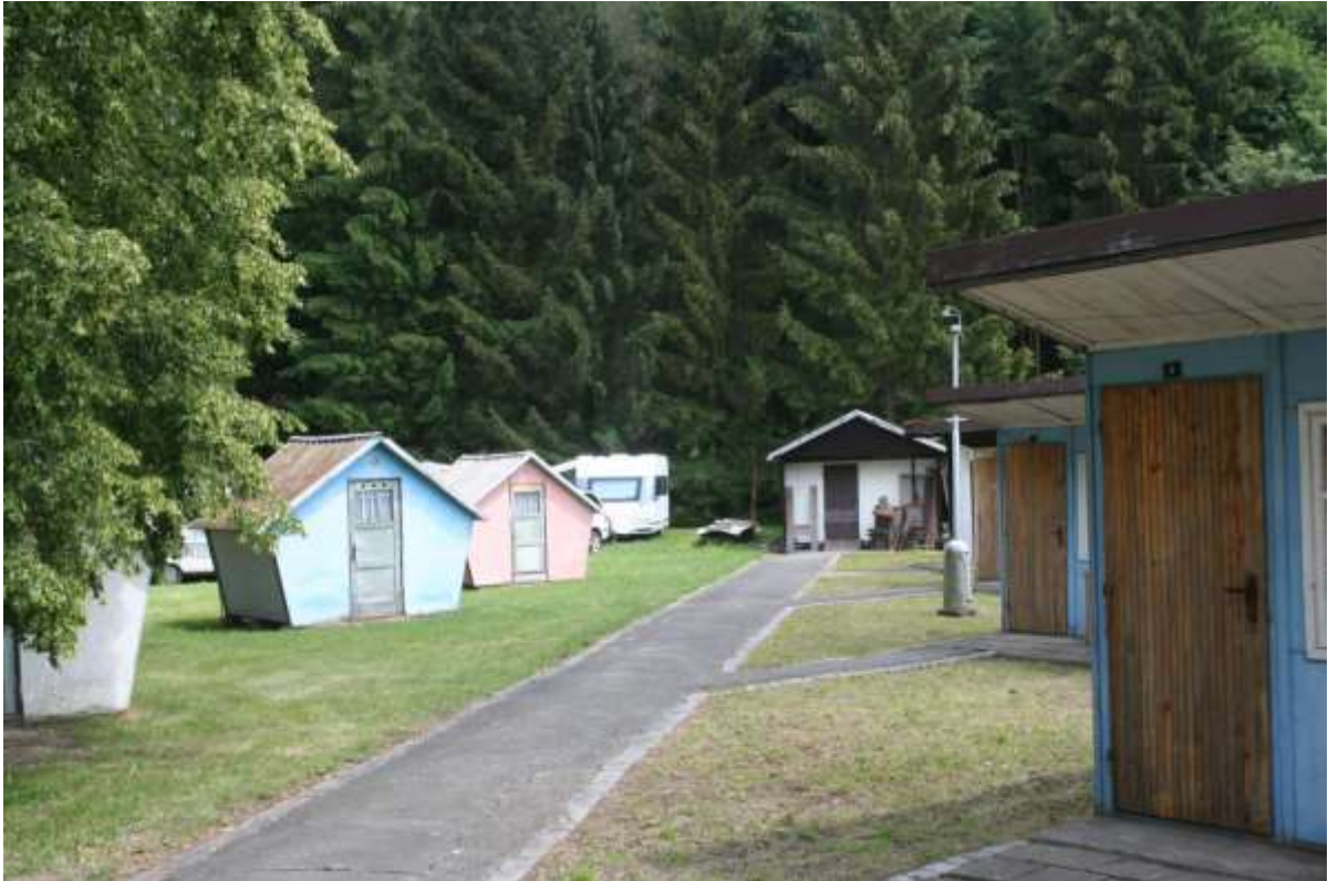
Camping Šternberk, links en rechts vakantiebungalows, witte gebouw is de werkplaats van de camping.