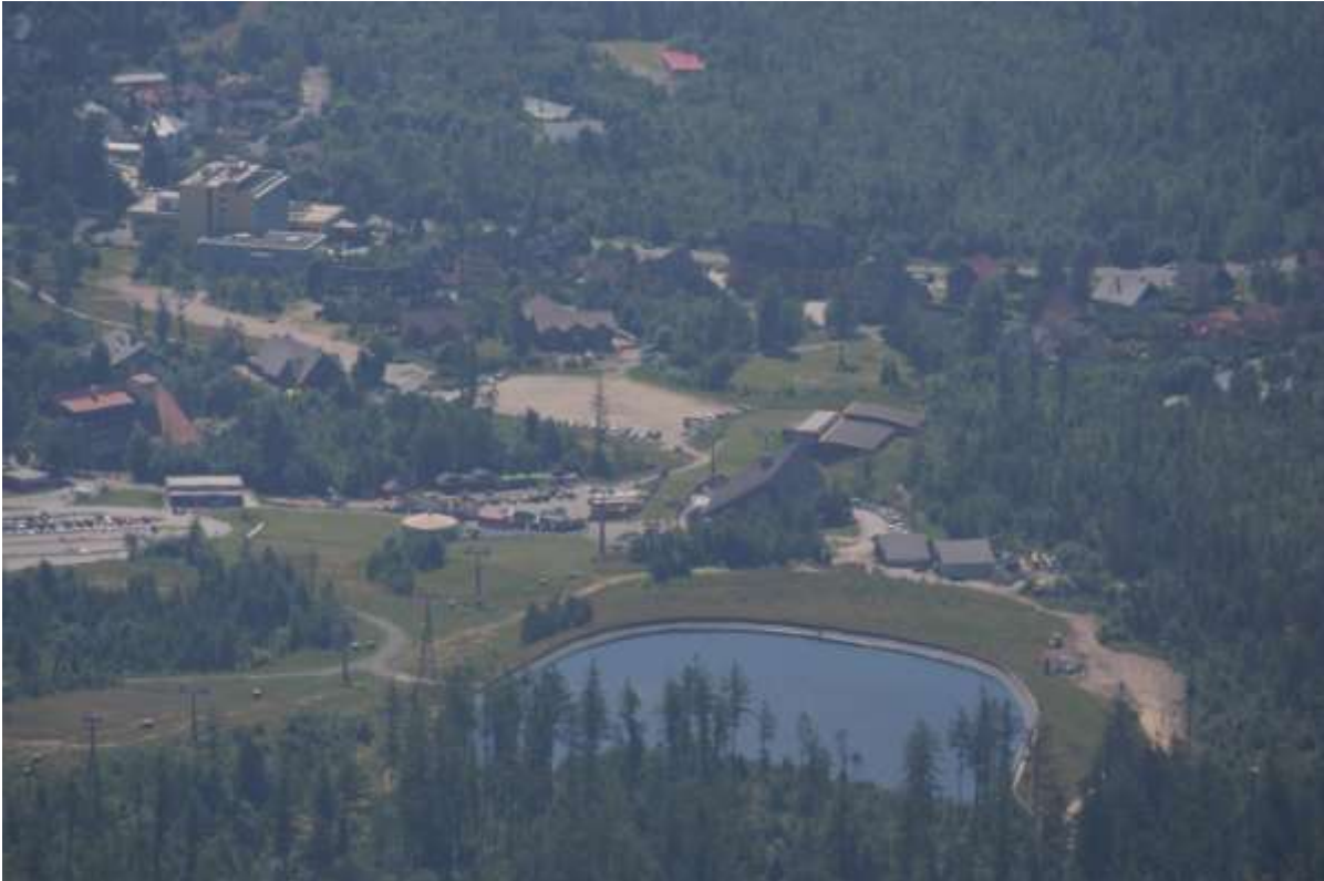
Het onderstation met parkeerplaatsen.