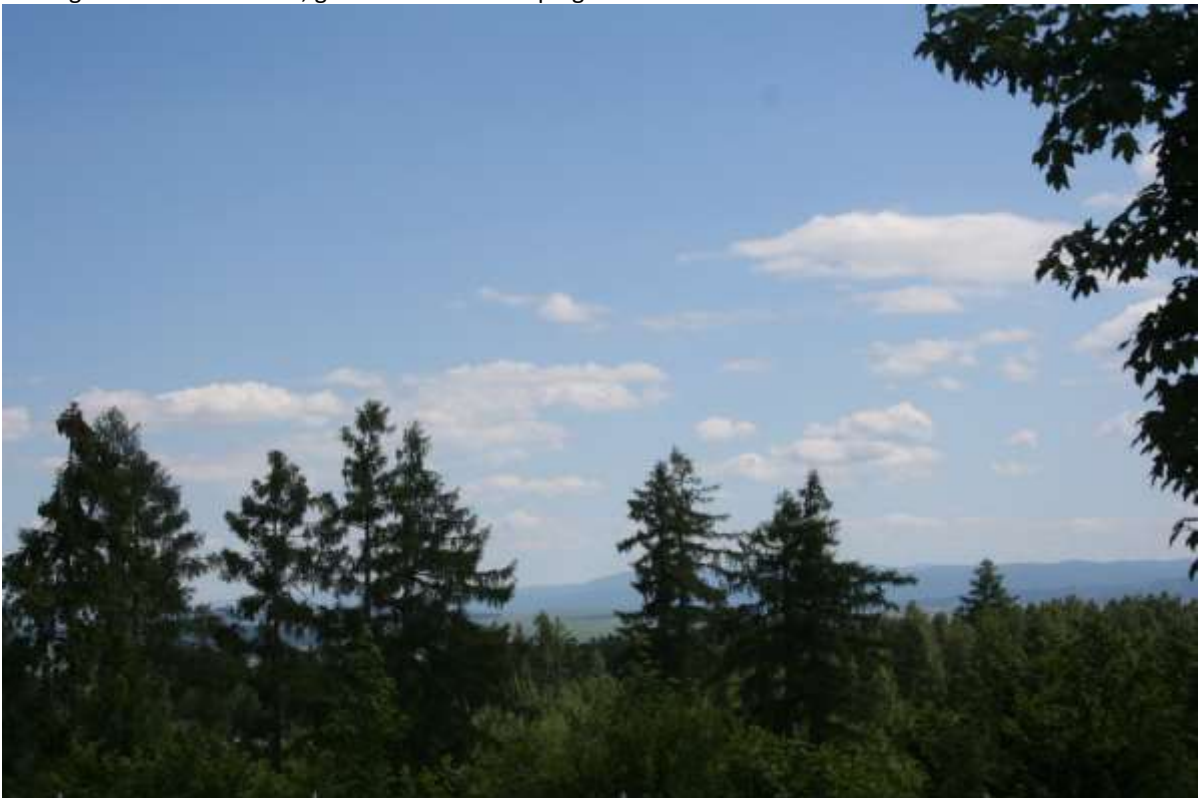
De Lage Tatra gezien vanaf de camping.