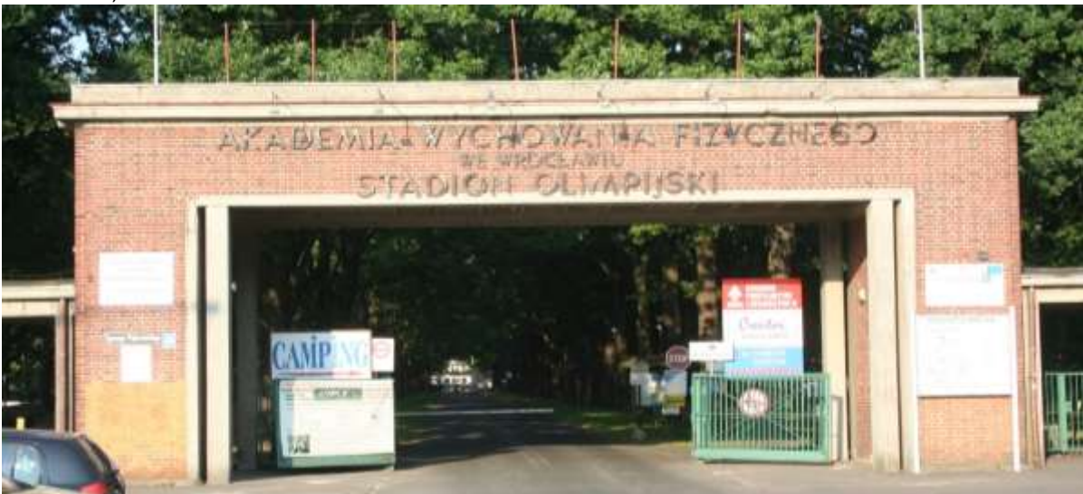
Camping Stadion Olympia, Wrocław.