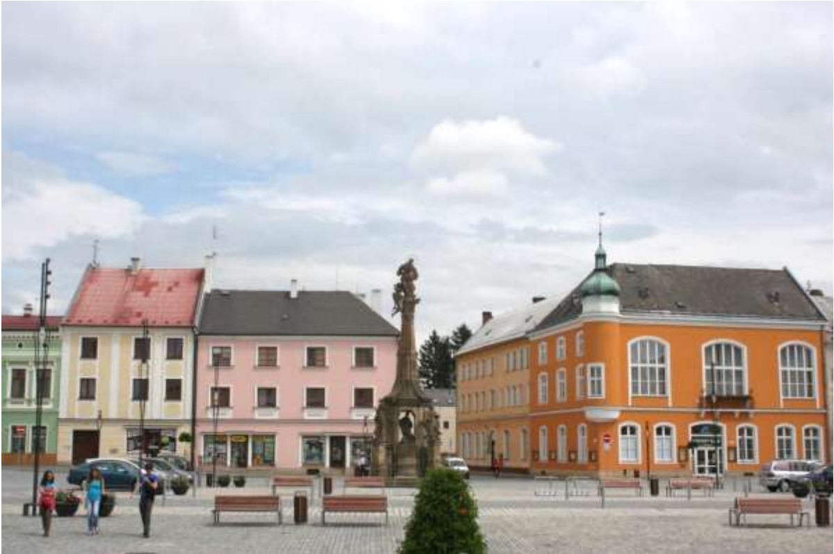
Pestzuil op de markt in Litovel.