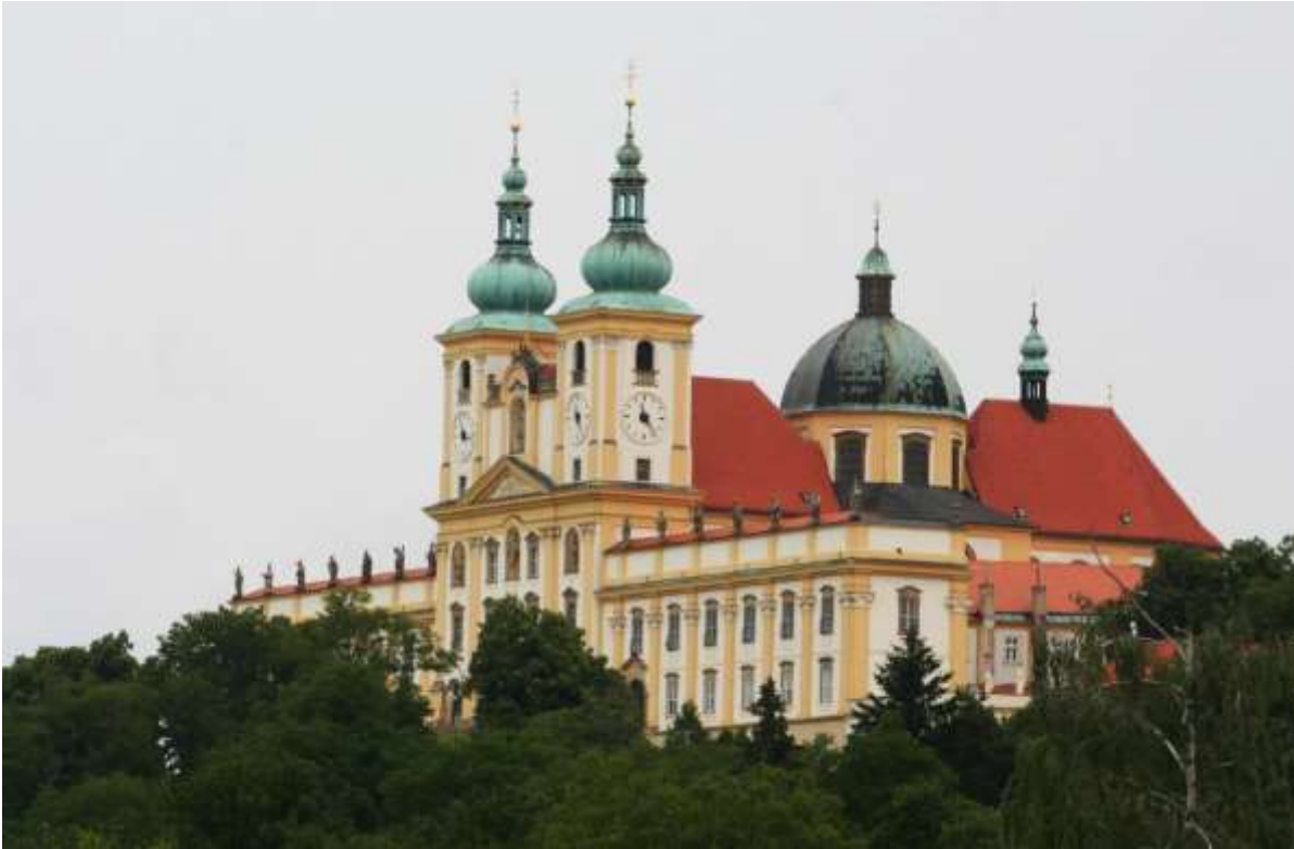
Klooster van Hradisko, Kopeček.