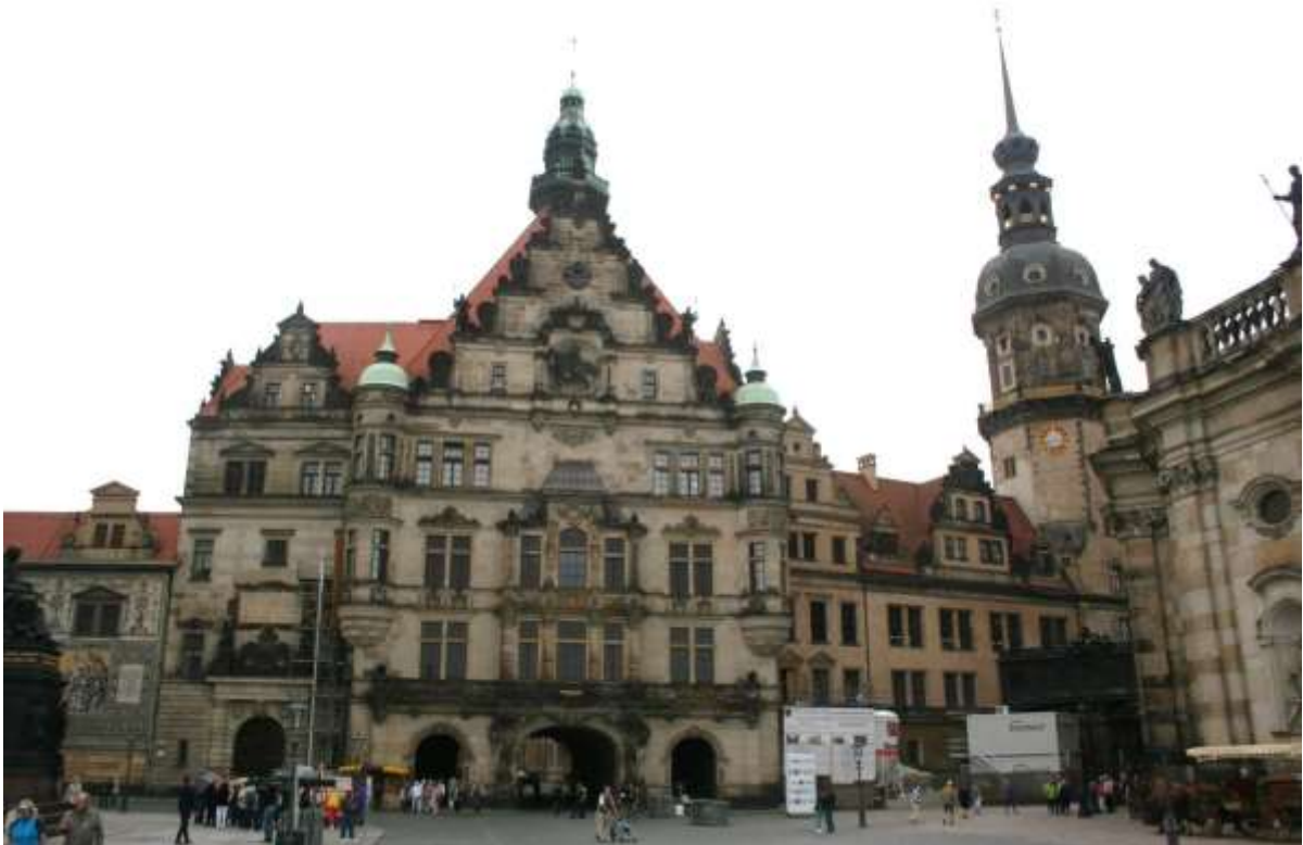
links de Burcht en rechts de Kathedraal.