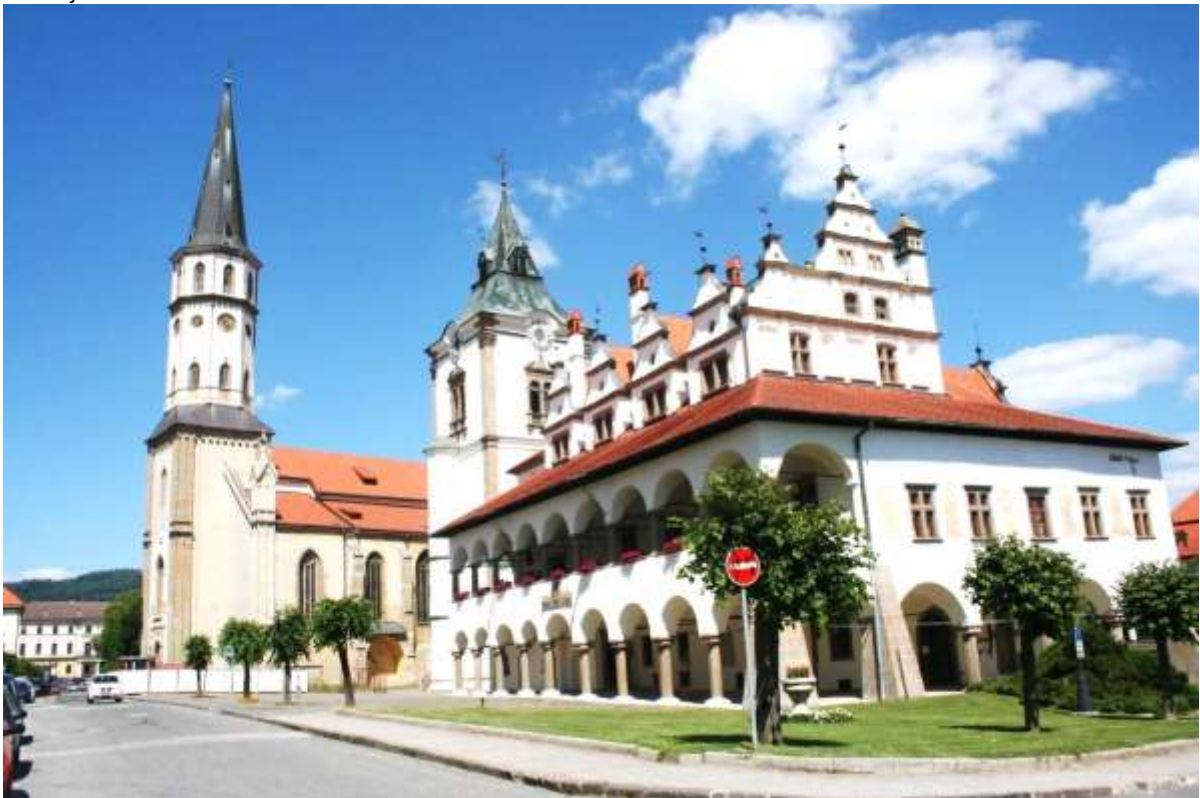
Het St. Jacobus kathedraal en het oude stadhuis.