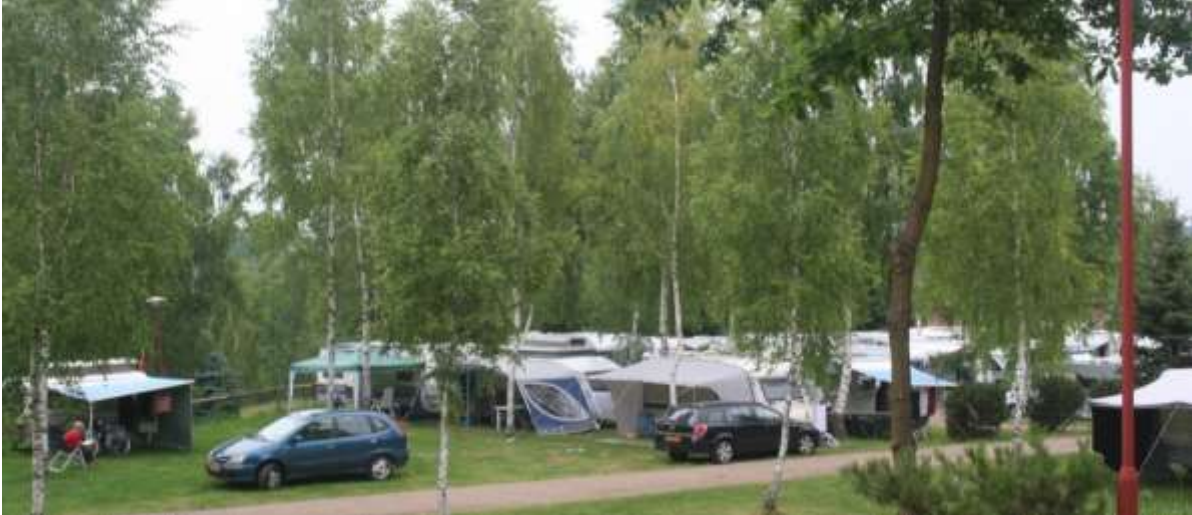
Camping Korona, achter een Deense camperclub.