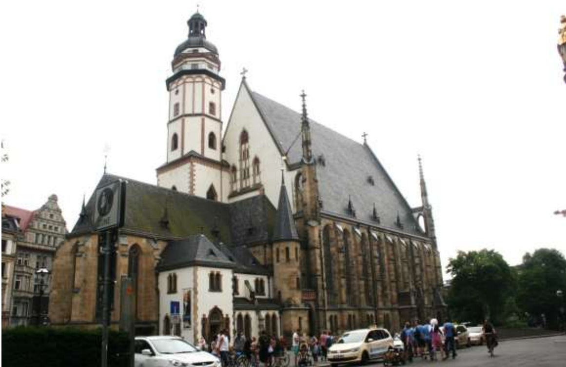
De Thomaskirche. (achterzijde)

Zaterdag 13 juni 2015. Clausthal-Zellerfeld – Leipzig.