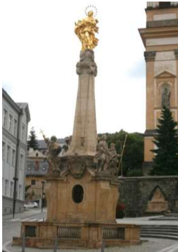
Pestzuil van Šternberk.