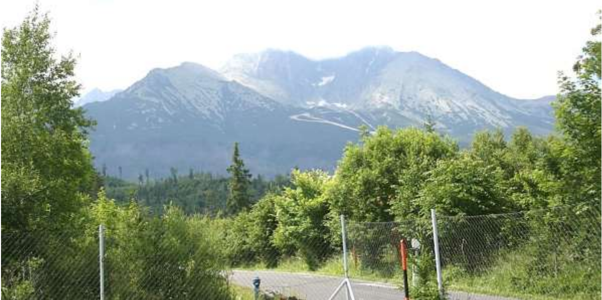
De Hoge Tatra in de wolken, gezien vanaf de Camping.

Donderdag 2 juli 2015. Zakopane – Stará Lesná. 59 km.