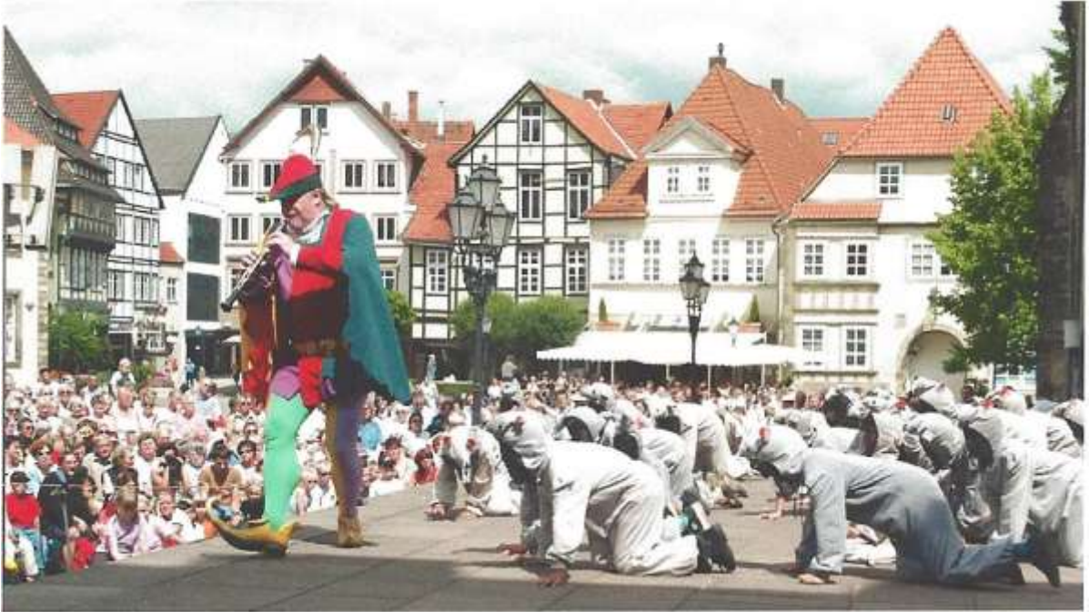
Rattenvanger van Hamelen.

Donderdag 11 juni, Wierden – Clausthal-Zellerfeld.