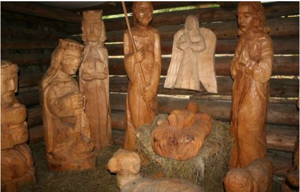
Beeldengroep aanbedding van de Wijzen uit Oosten.