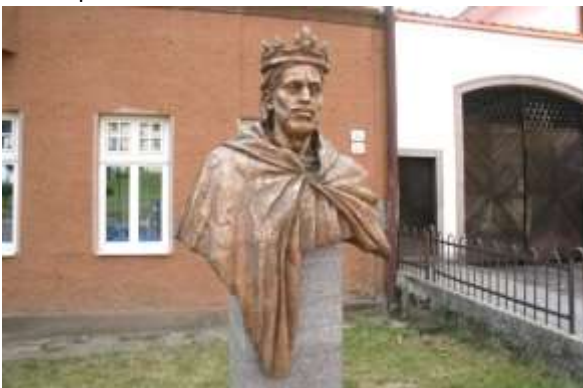
Koning Karel I van Anjou..