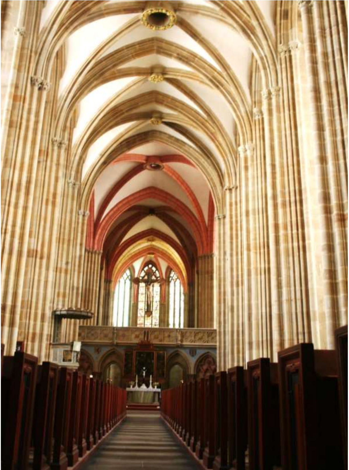
De Dom van Meissen.

Maandag 15 juni 2015. Dresden (Kleinrörsdorf).