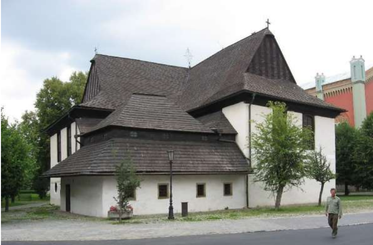
De oude houten Evangelische Lutherse kerk. Gebouwd met financiële steun uit Noord-Europa.