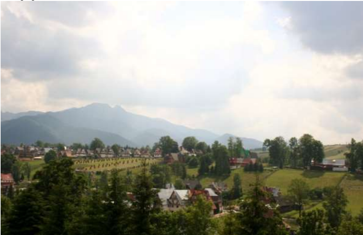
Uitzicht vanaf het bordes van de kerk.