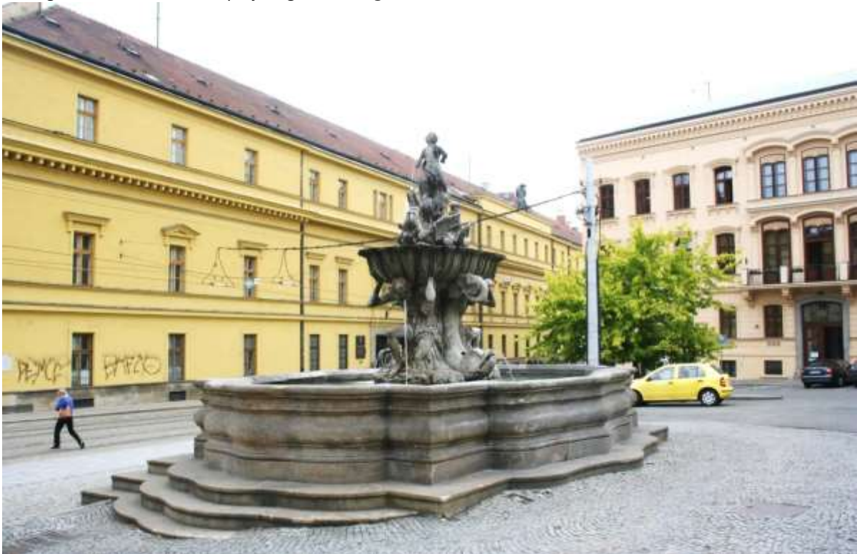
Een van de fonteinen van Olomouc.

Zonnig/lichtbewolkt en een spatje regen. 11-16 gr.