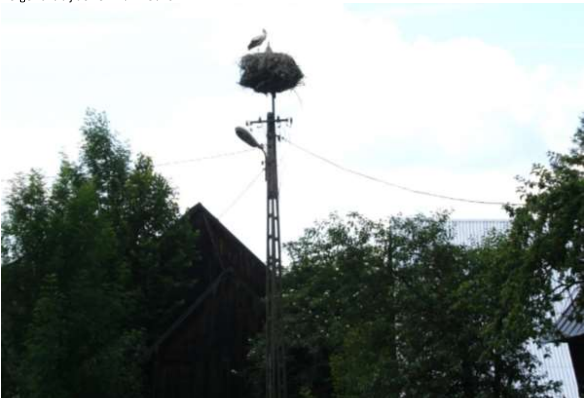
Ooievaars op een nest in Debno.