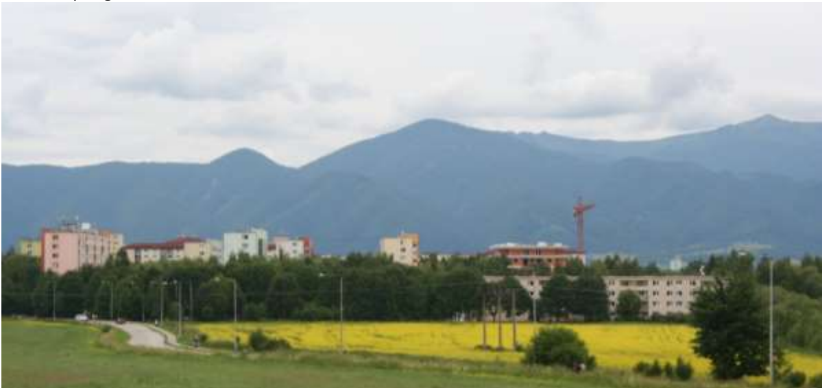
Gezicht op Martin en de Hoge Tatra.