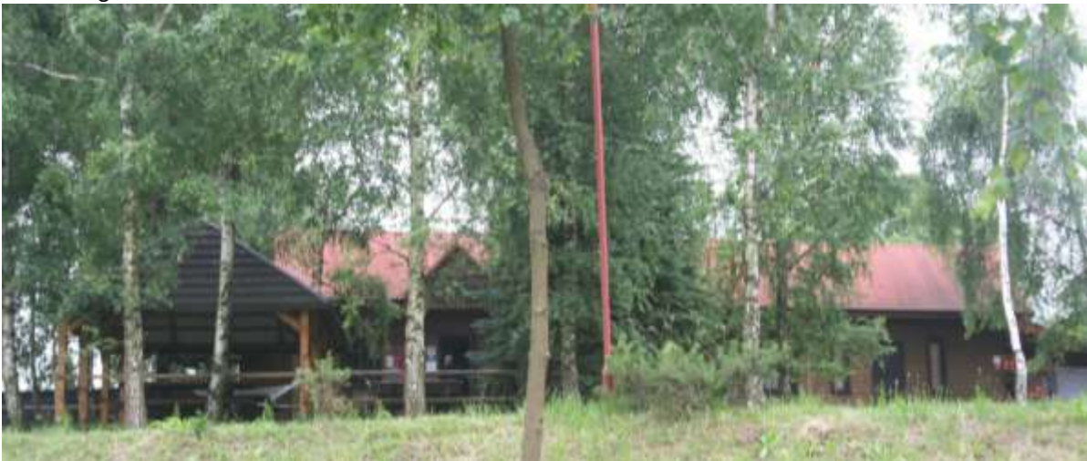
Het kantoor annex de campingbar/restaurant.