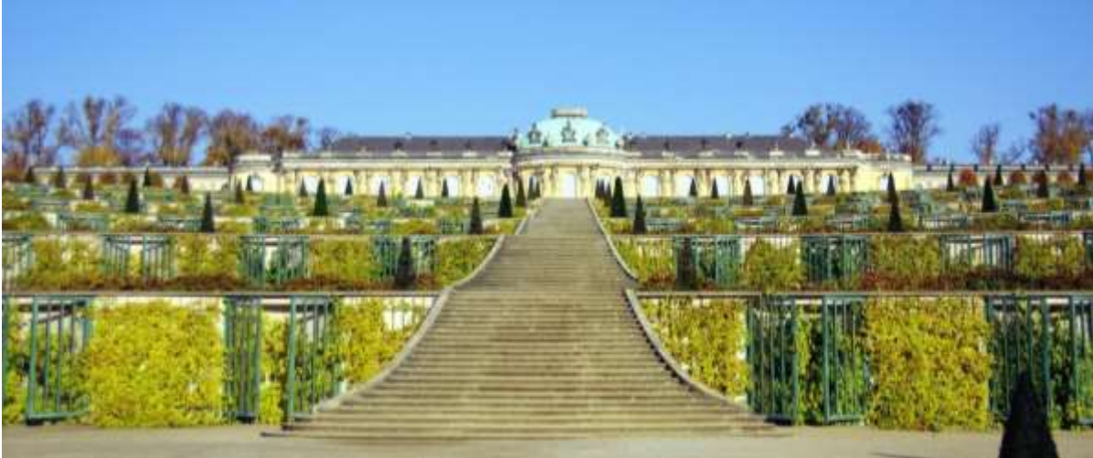
Paleis Sanssouci, Potsdam.