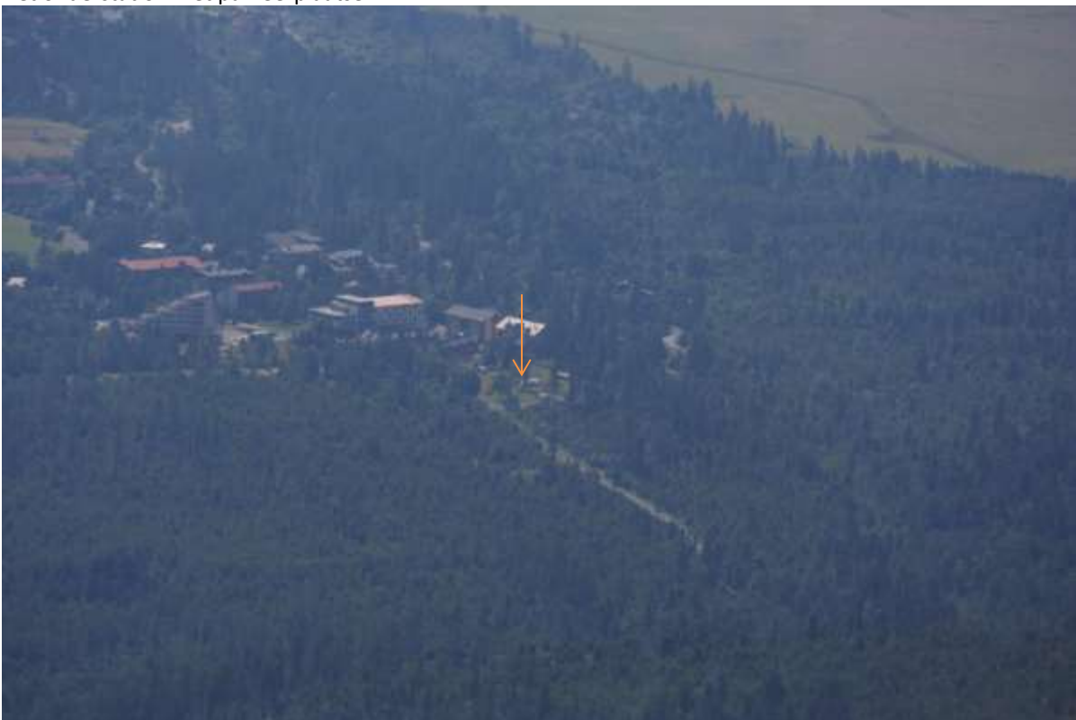
De pijl wijst naar de plek waar onze caravan staat, gezien vanaf de berg.