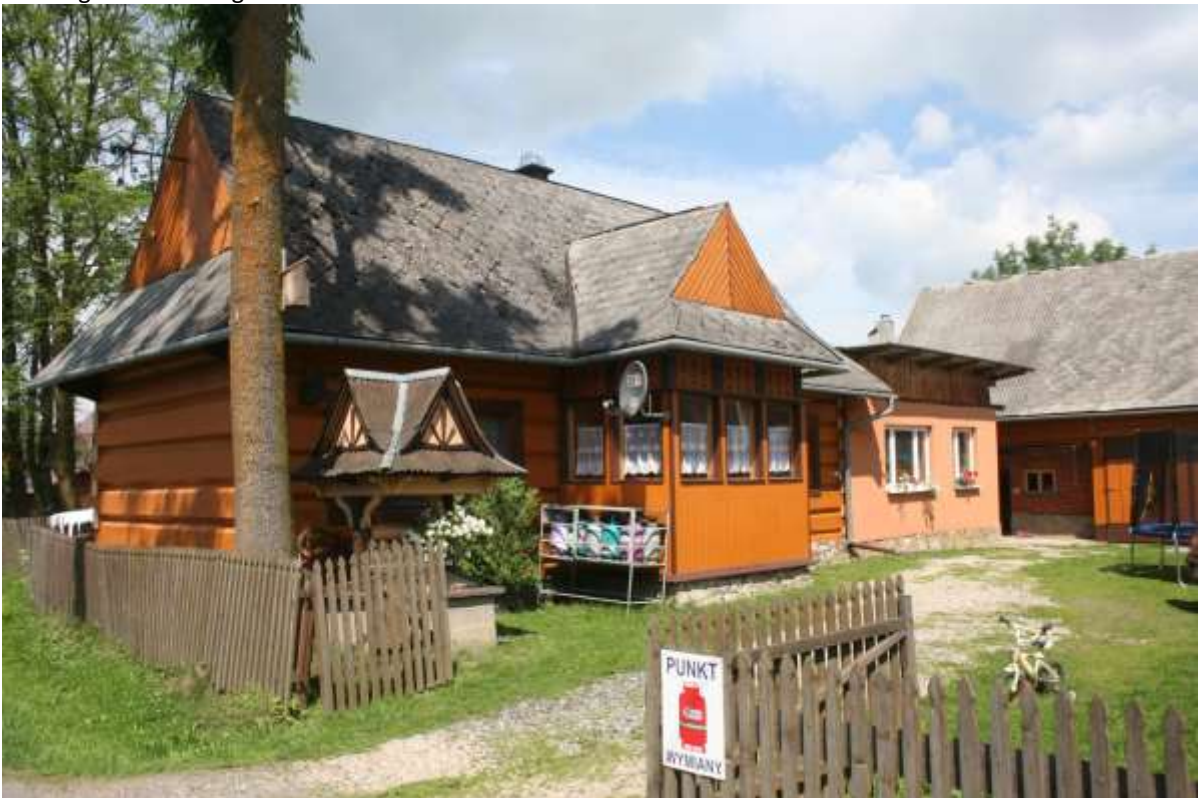
Hier verkopen ze flessengas.