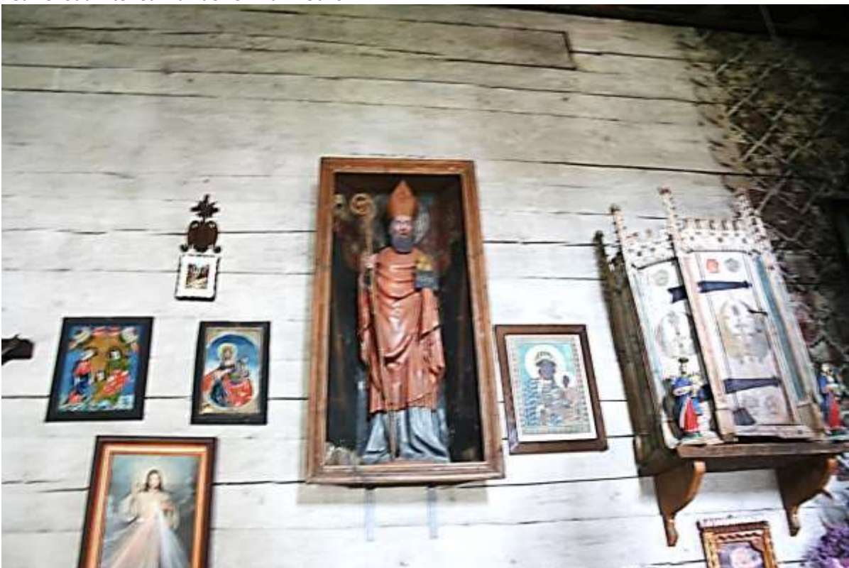
Beeld van St. Nicolaas uit 1420, rechts een Hostieschrijn (14 e eeuw) die drie eeuwen al niet meer in gebruik is.