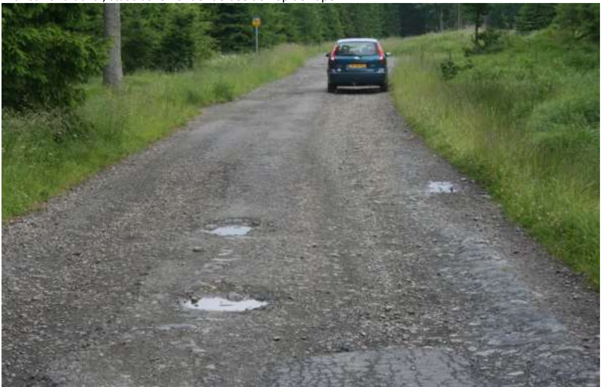
Een van de allerbeste stukken weg aan het einde van het bos.