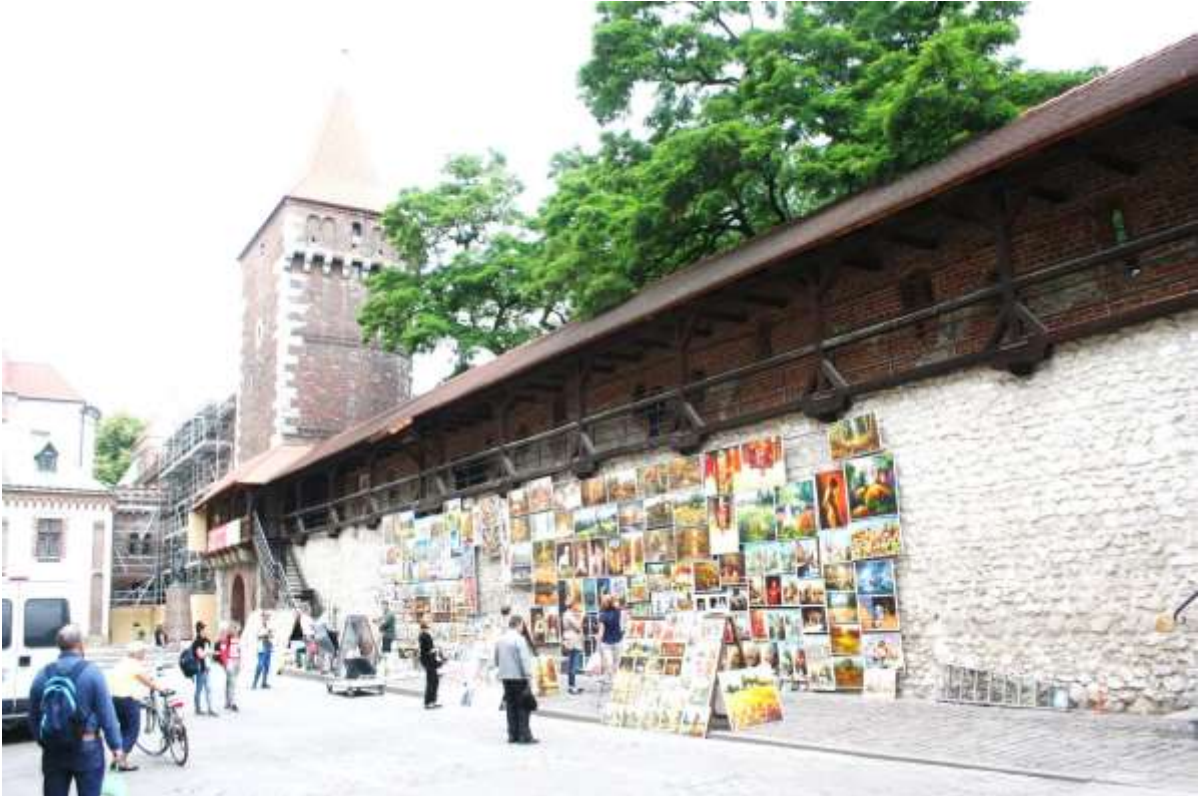
Schilderijenverkoop, bij de stadsmuur.