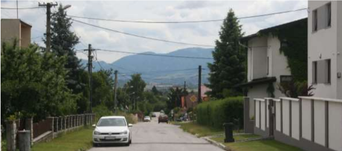
De omgeving van de camping.