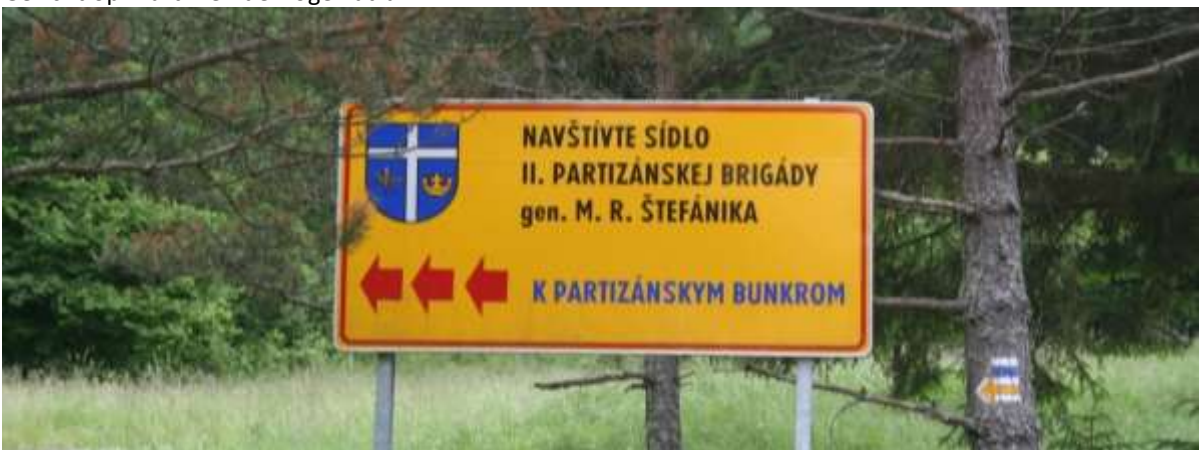
Het bord in het bos, over de Partizanen.