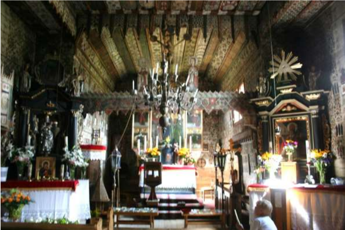
Eeuwenoud interieur van de kerk van Debno.