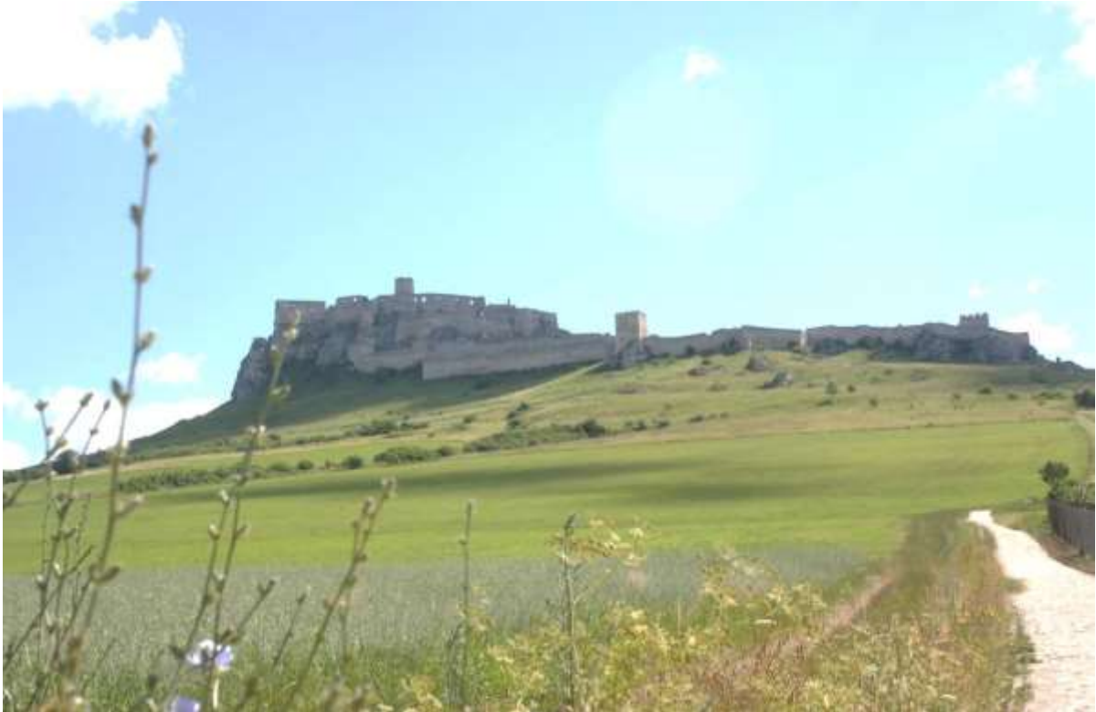
Spišské Hrad (Spiss-Kasteel).