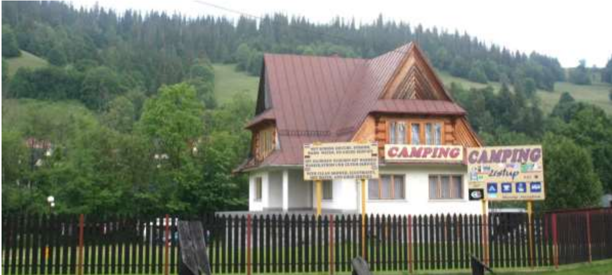
Camping Ustup, Zakopane.