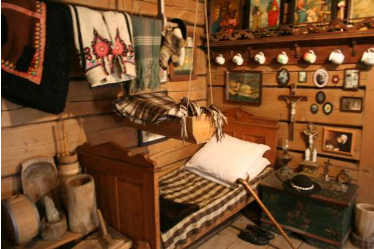
Museumpje, tweepersoonsbed met wiegje er boven.