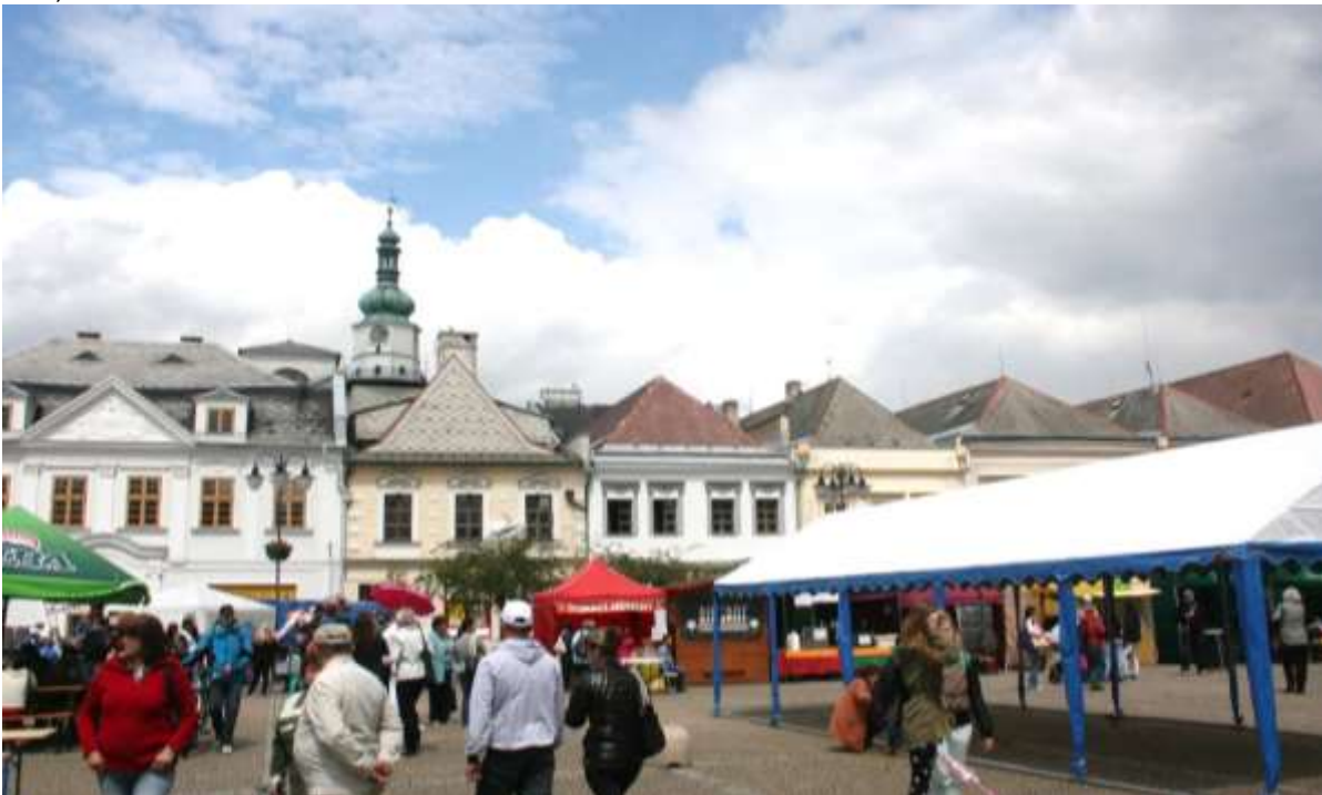
Markt Bruntál met eten- en drinkkraampjes.