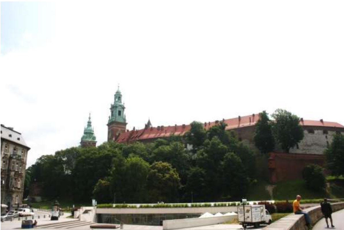
De Koninklijke Burcht Wavel, van waaruit de Hertogen en Koningen vroeger het land bestuurden.