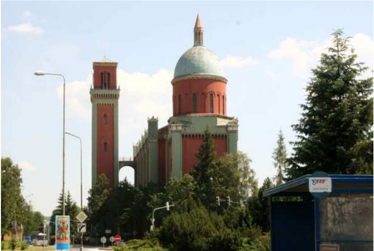
De nieuwe evangelische Lutherse kerk, Kežmarok.