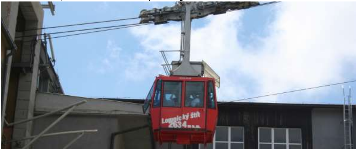
Met deze kabelbaan kun je naar de top van de berg op 2634 meter hoogte.