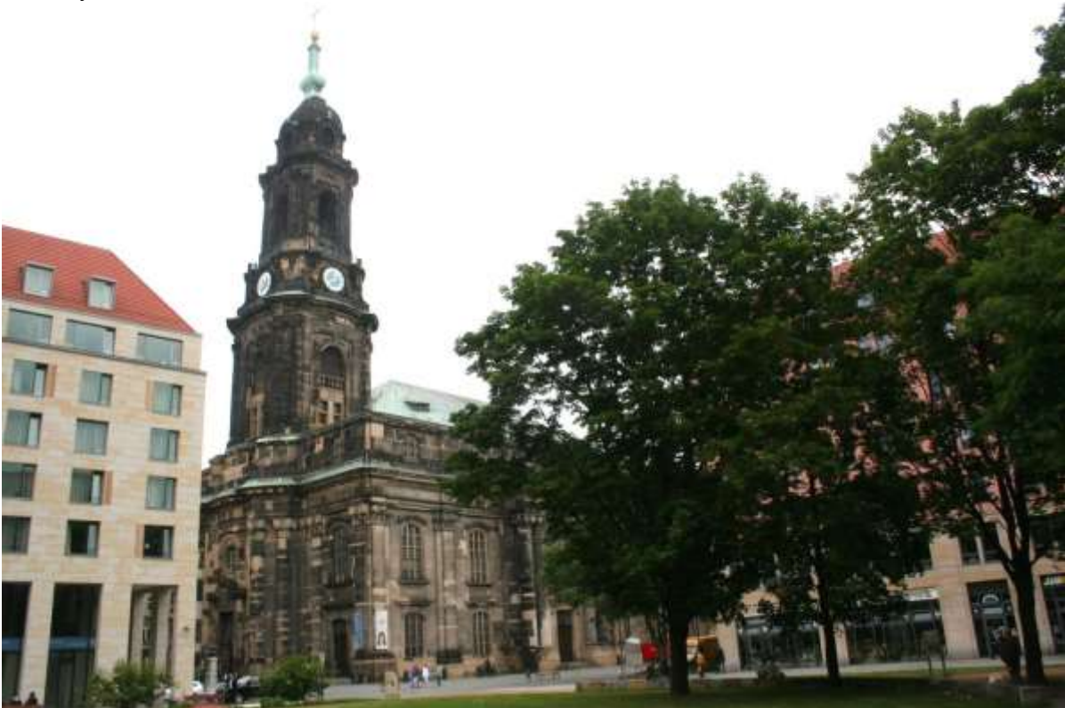
De Kreuzkirche, Dresden.