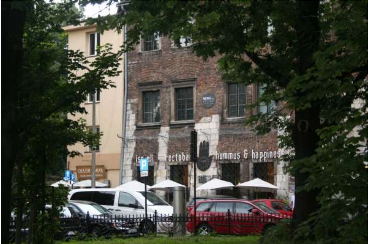
De boekwinkel annex café in de Joodse wijk, Kazimierz.