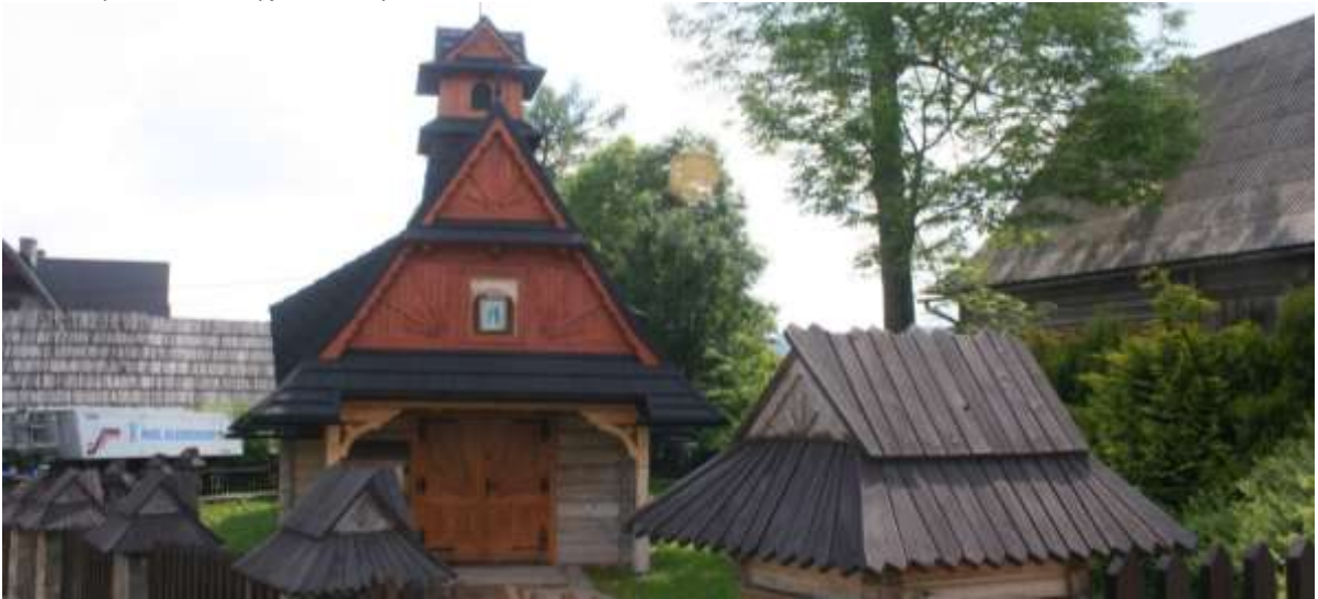
Evangelische Kerk van Nowa Bystre.