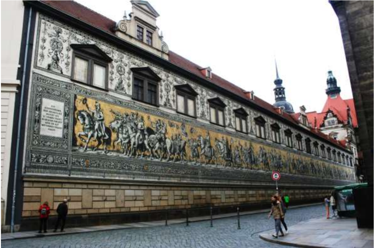
De Koninklijke stoet op de Burcht in mozaïek, Dresden.

Maandag 15 juni 2015. Dresden (Kleinrösdorf).