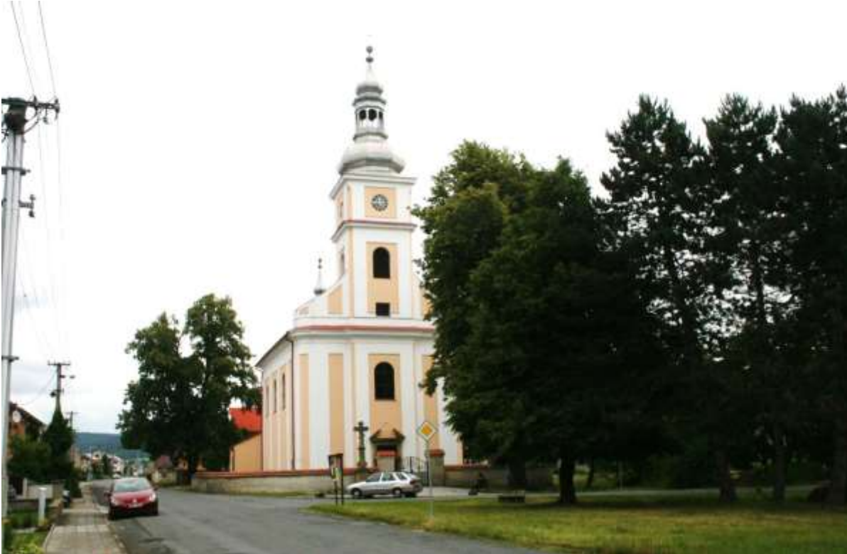
Kerkje onderweg tussen Olomouc en Šternberk.