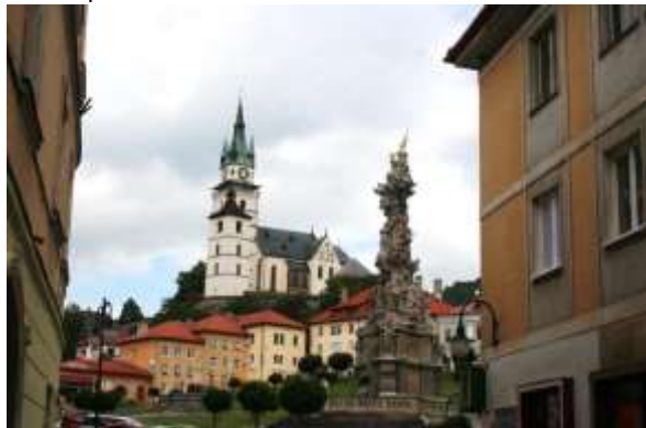
St. Katarina kerk met Pestzuil.