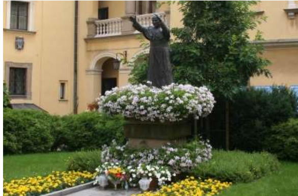
Standbeeldje van Paus Johannes Paulus II.