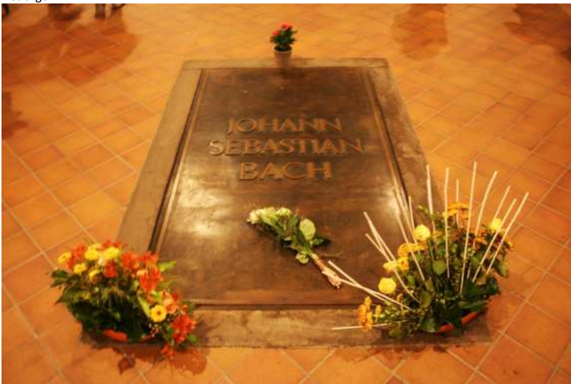
Bronzengrafplaat van de wereldberoemde componist: Johann Sebastian Bach.