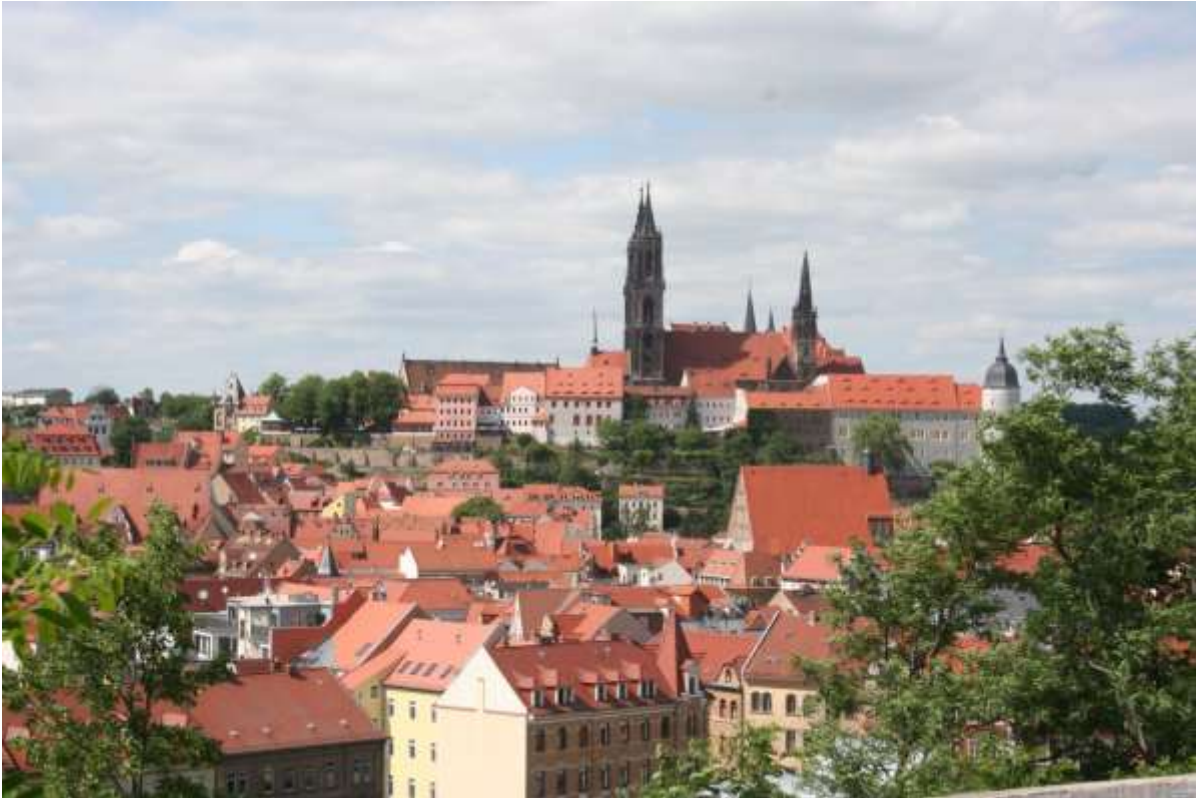
De stad Meissen

Maandag 15 juni 2015. Dresden (Kleinrörsdorf).