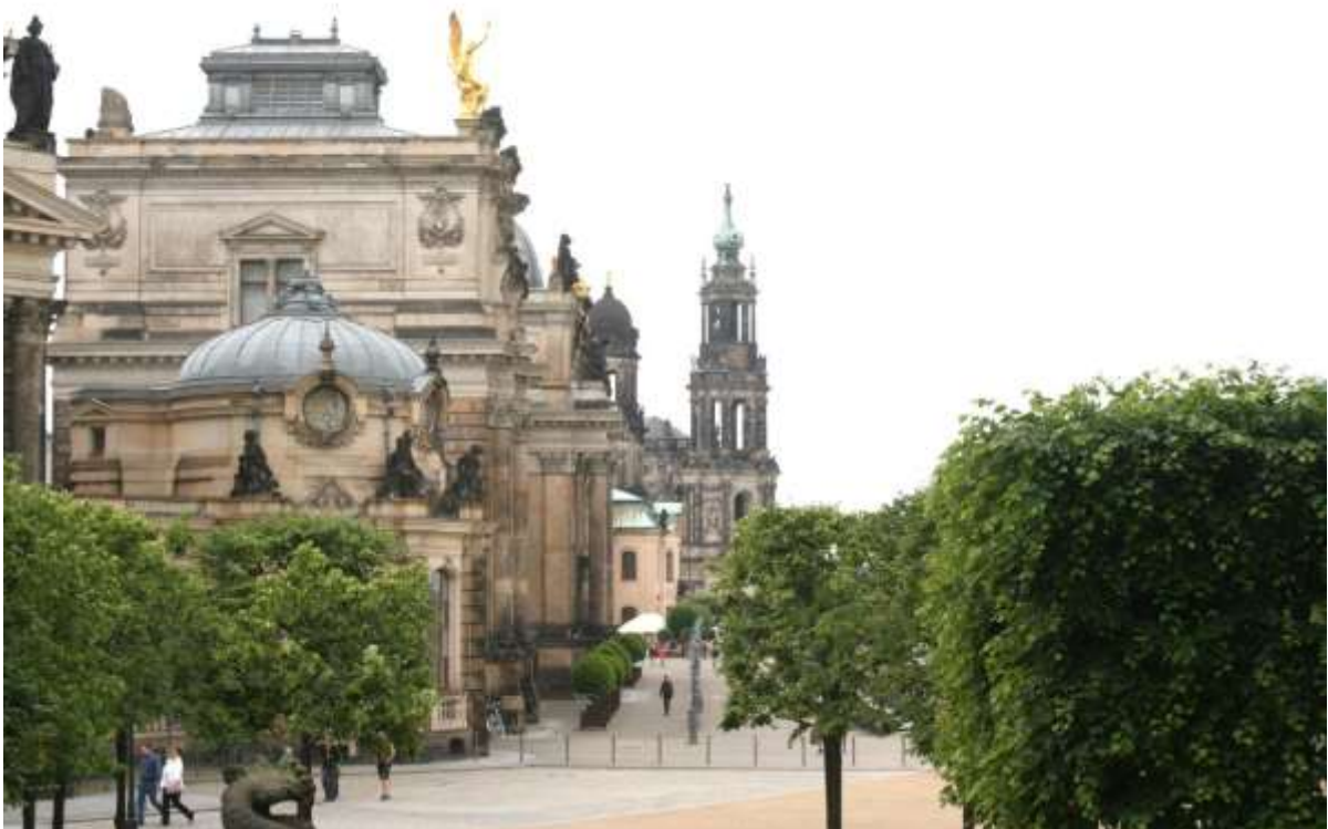
Gebouwen op de linkeroever.