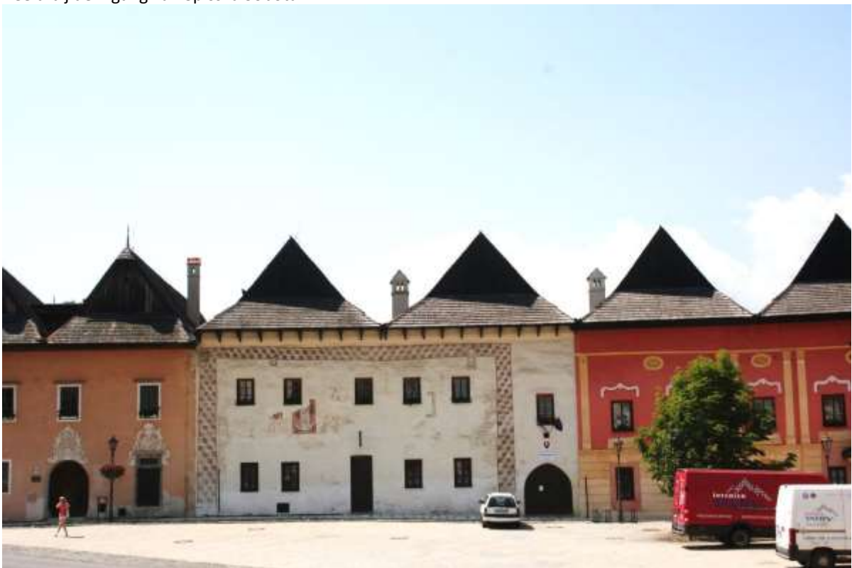
Plein in Spisska Sobota.