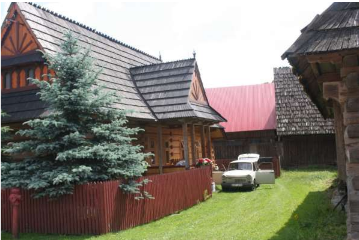
Huis met een originele Trabant uit de DDR.