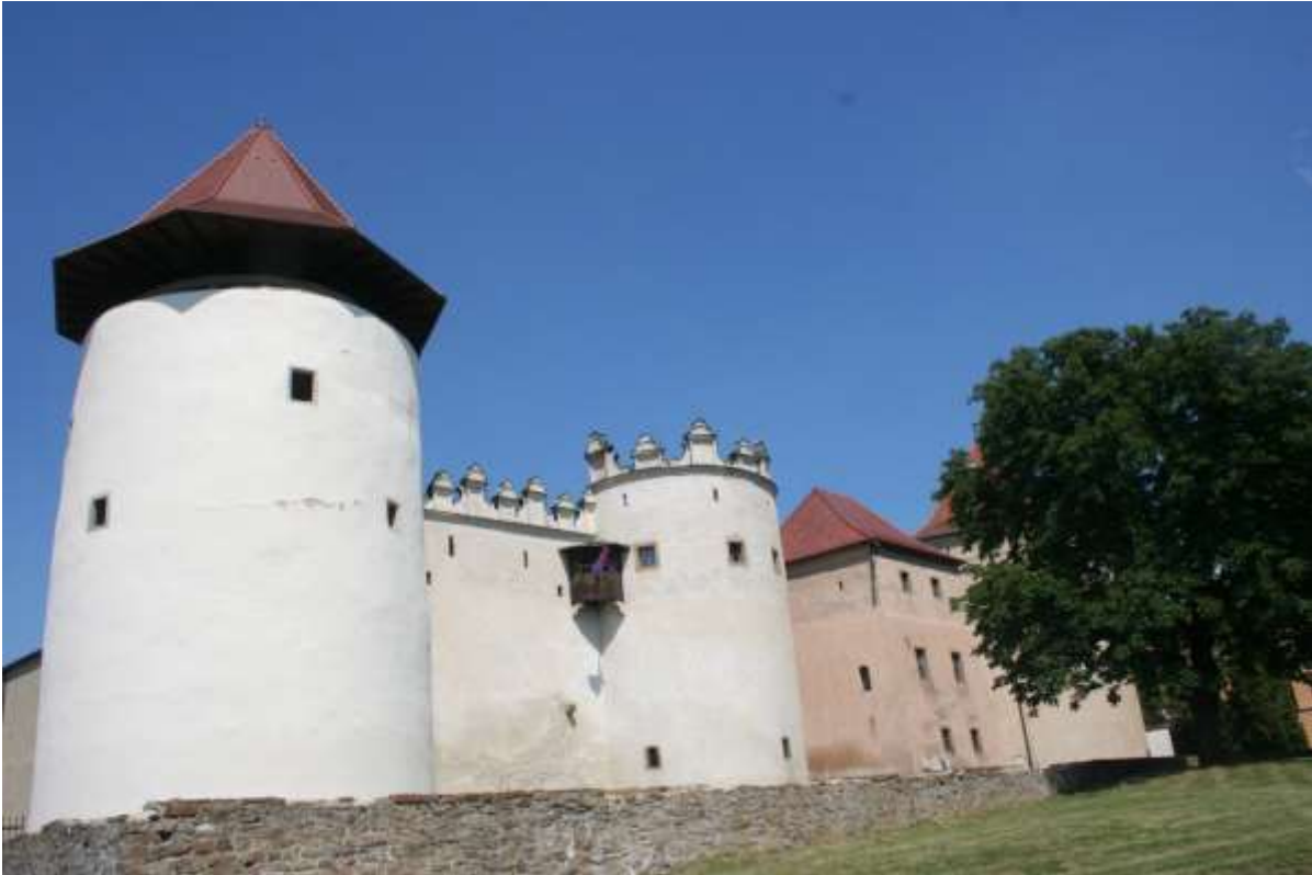
Hrad Námestie (kasteel Namestie), Kézmarok.