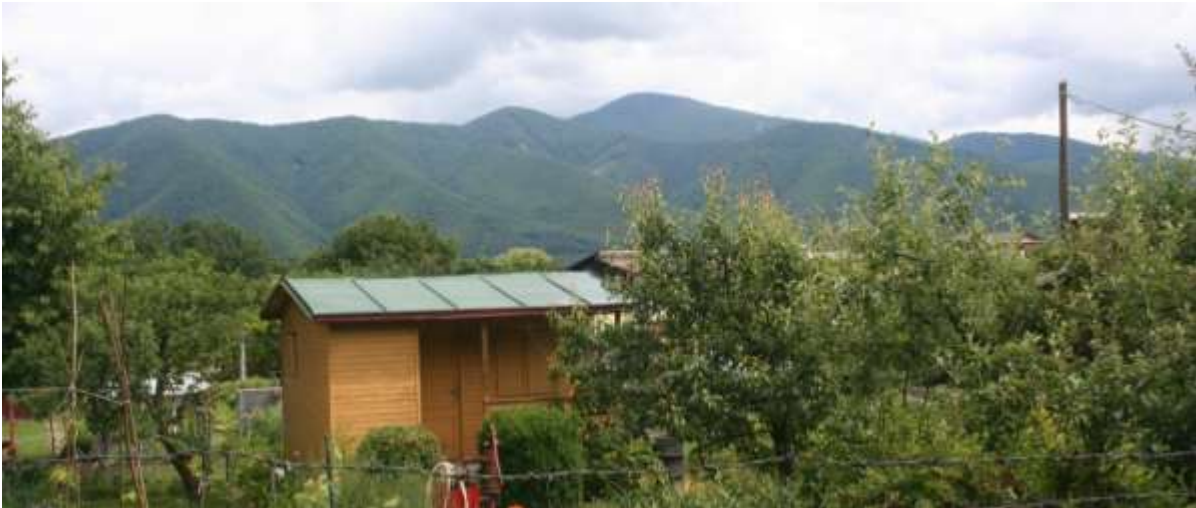
Volkstuinen achter de camping.