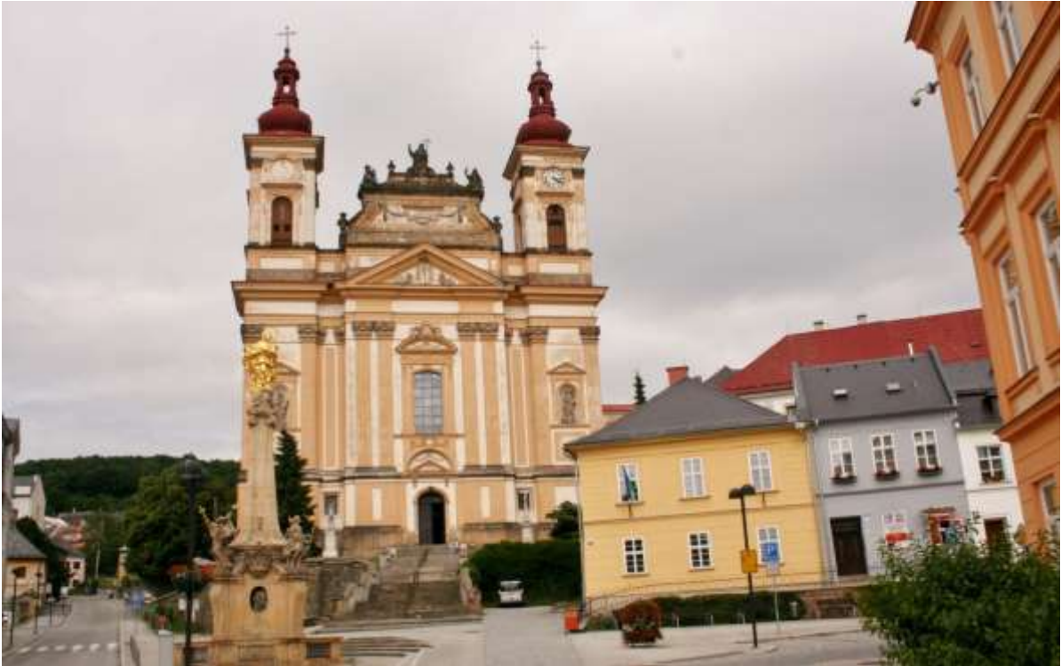
Kerk Šternberk, met links ervoor een pestzuil.

Donderdag 18 juni 2015 Hrádek nad Nisou – Šternberk