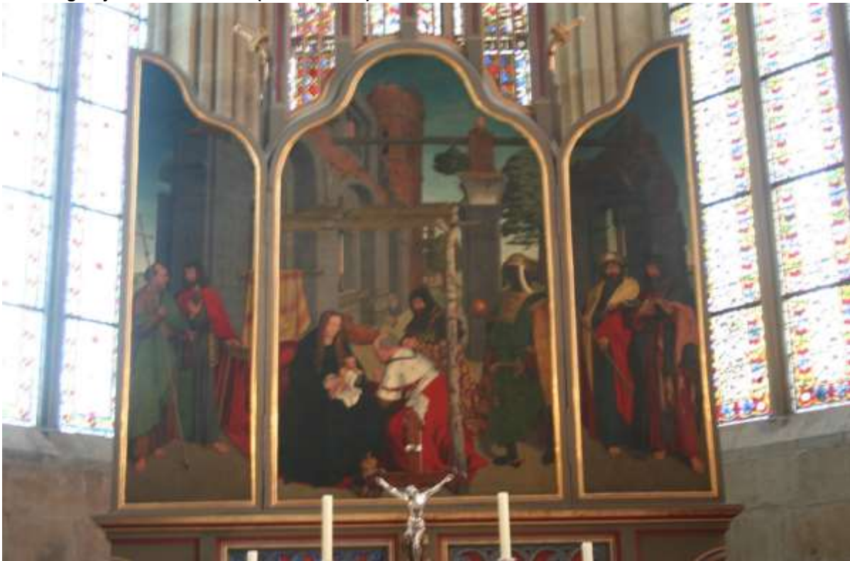
Altaar Dom Meissen. Op het rechter paneel staat St. Jacobus met schelp en staf.

Maandag 15 juni 2015. Dresden (Kleinrörsdorf)