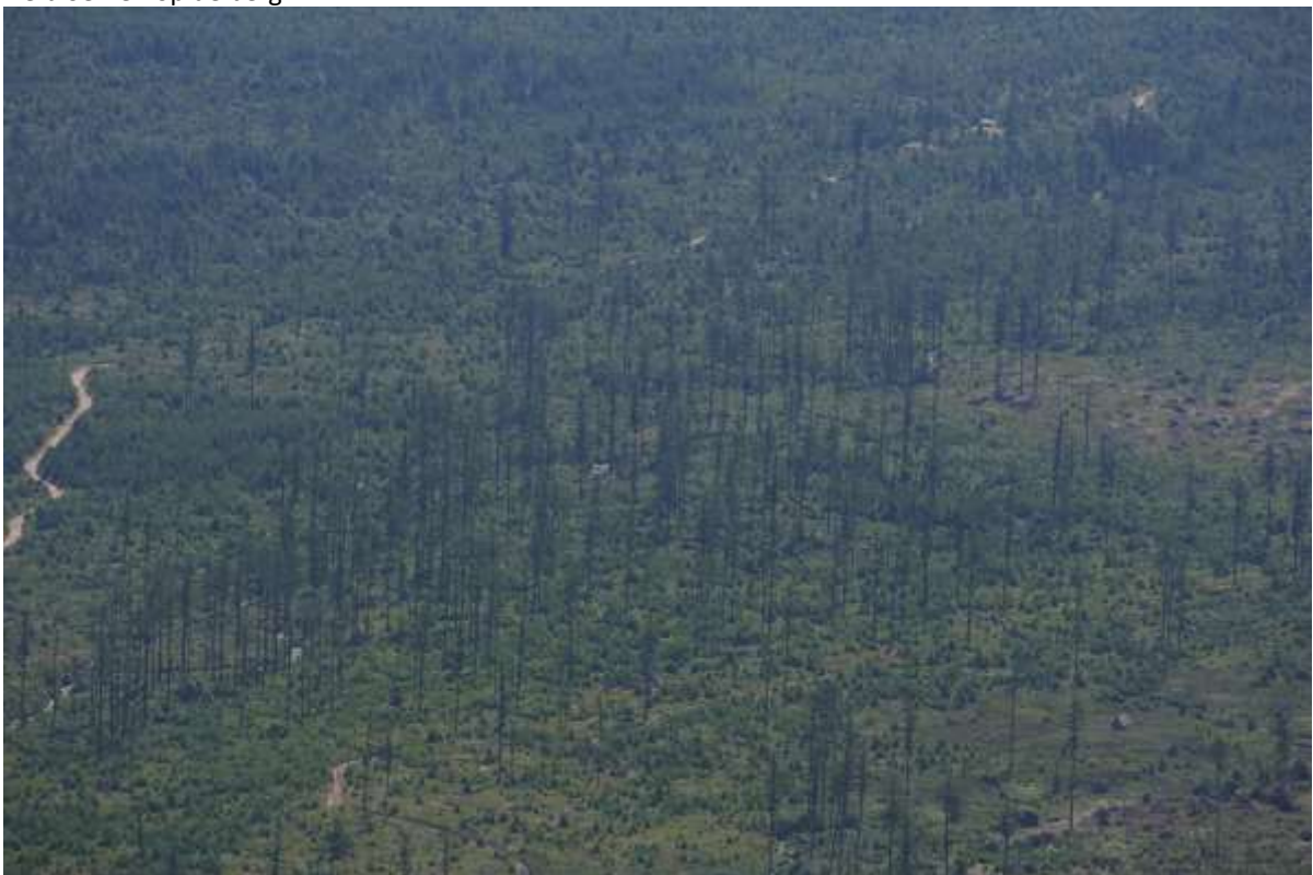
De kale boomstaken als gevolg van milieuvuiling.