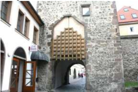
Binnenpoort met valhek.