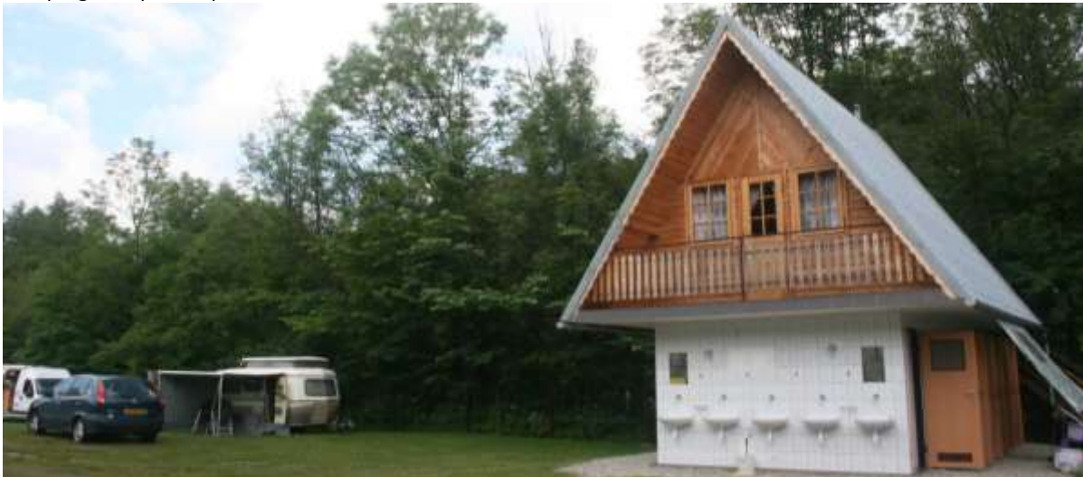
Toiletgebouw op de camping.