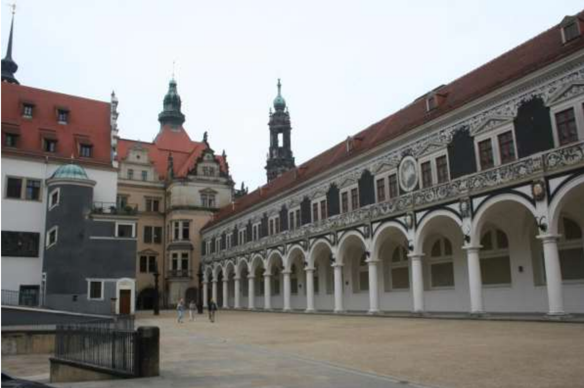
Achterzide Burcht Dresden

Maandag 15 juni 2015. Dresden (Kleinrörsdorf).