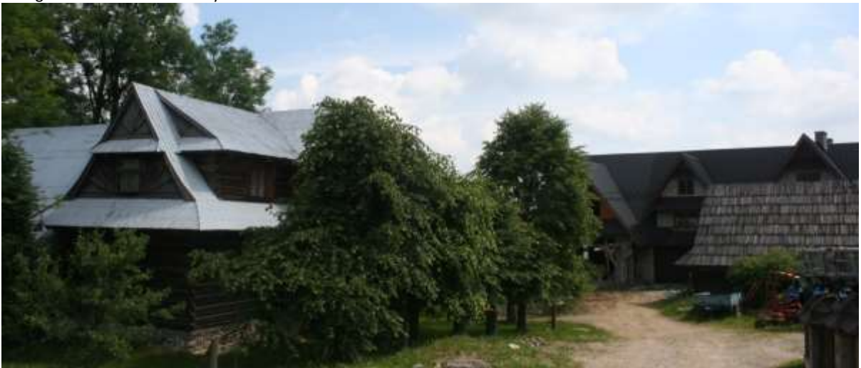
Huizen en boerderij in Nowa Bystre.