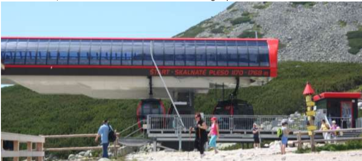
Het middenstation, het Skalnaté Pleso duidt op een bergmeer in de buurt.