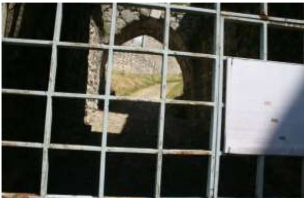
Gesloten hek aan de achterzijde.