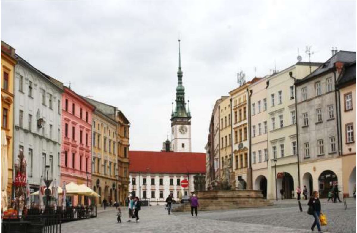
Plein bij de Maria Pestzuil.