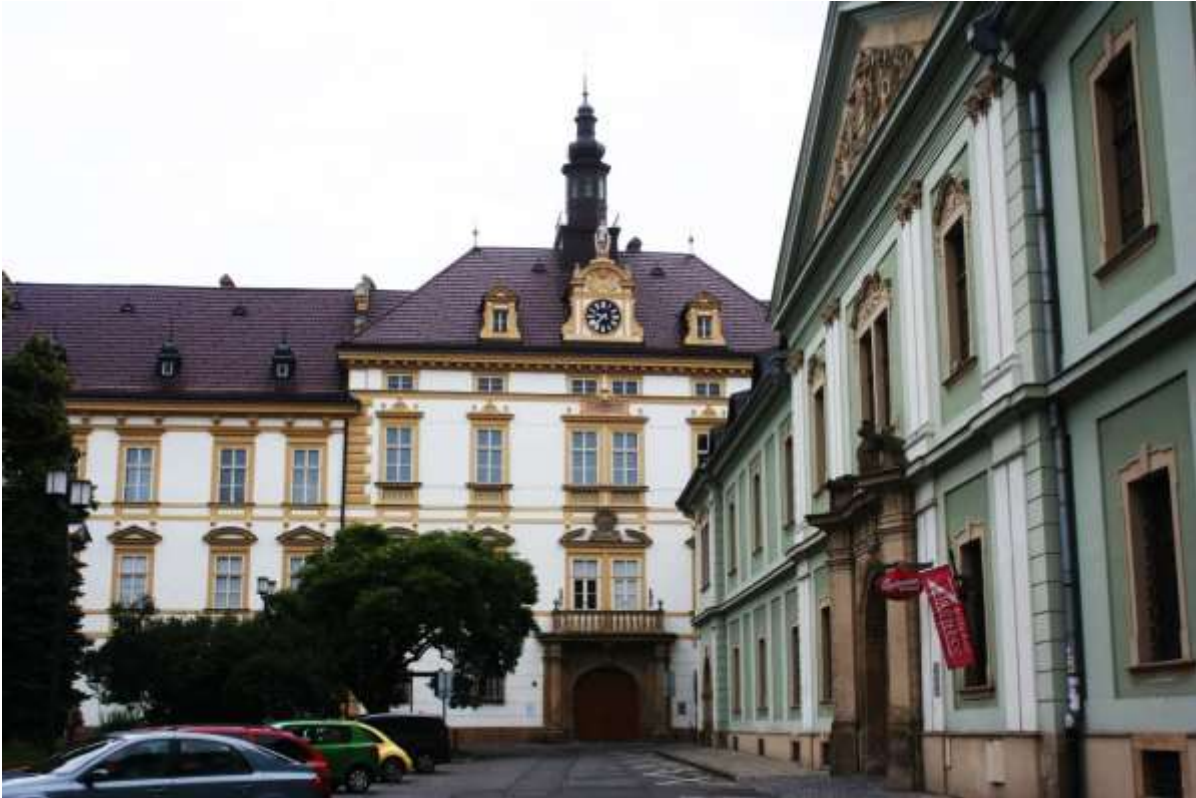
Aartsbisschoppelijk paleis, rechts een Universiteitsgebouw.