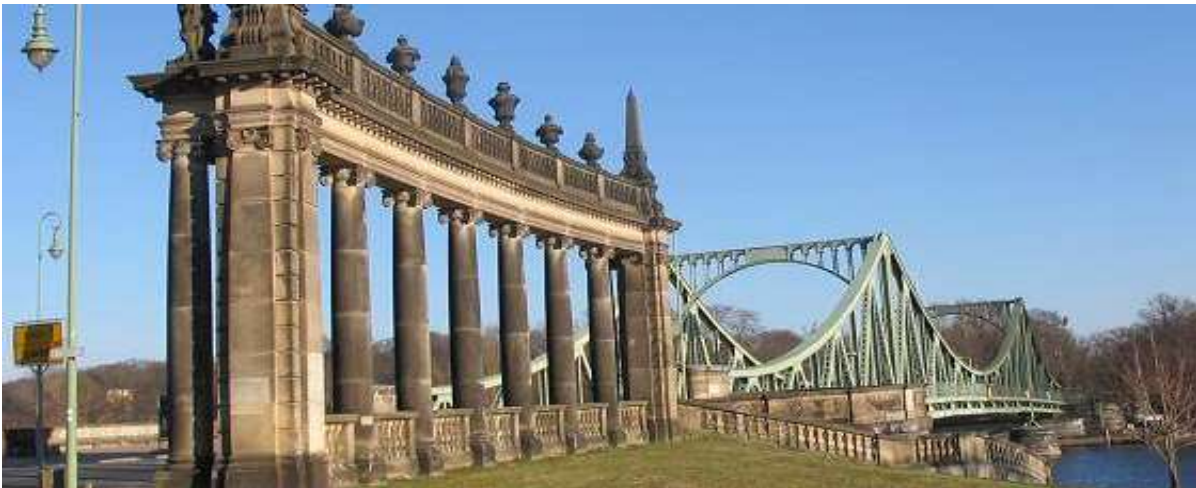
De Glienicker Brücke, hier werden tijdens de koude oorlog de spionnen uitgewisseld. Twee verschillende groene kleuren zijn nu nog te zien op de brug, het vroegere verschil tussen Oost en West.