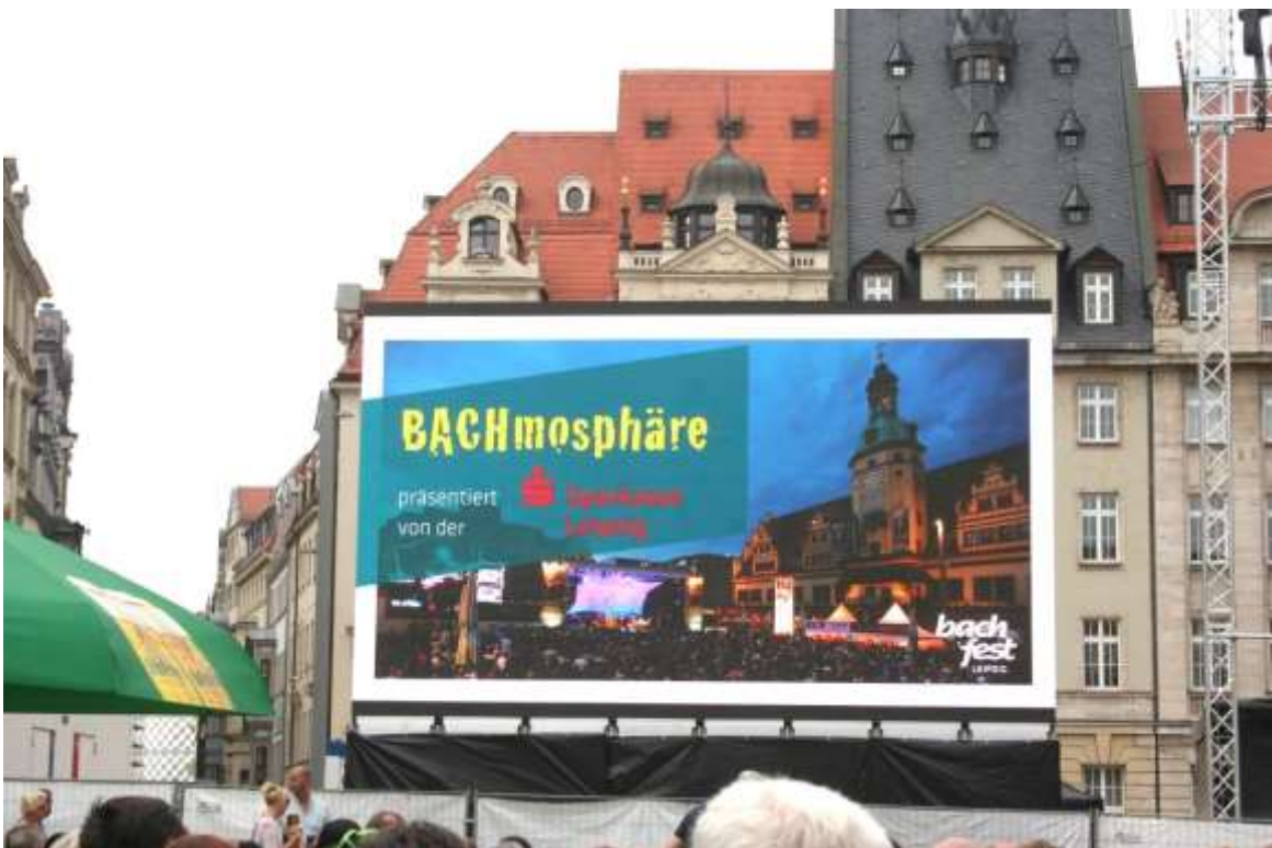
Op dit grote scherm was het Bach concert te zien