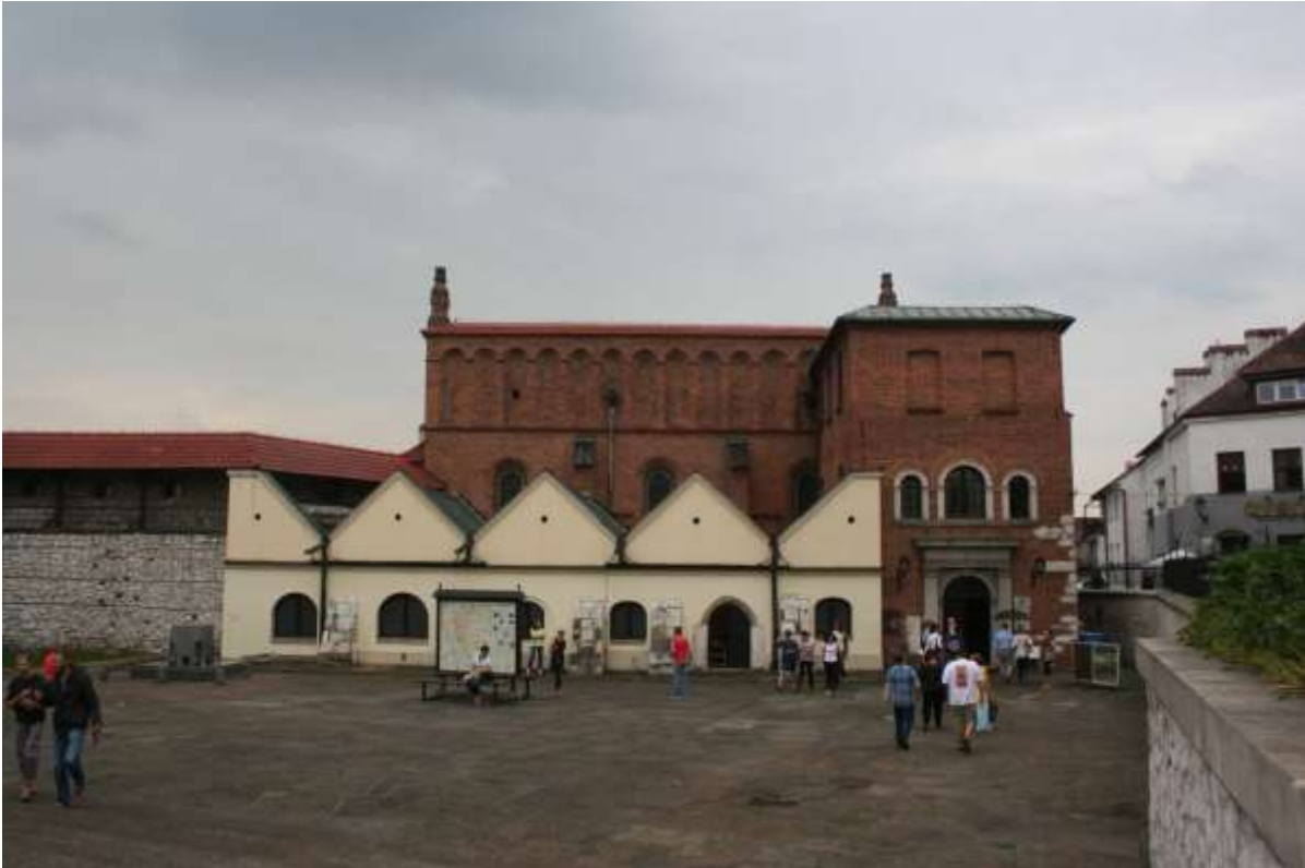
Joodse Synagoge in de wijk Kazimeirz.