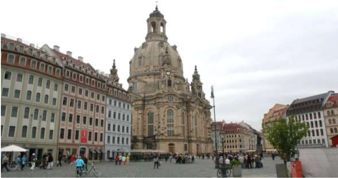
De Frauenkirche, Dresden.

Maandag 15 juni 2015. Dresden (Kleinrösdorf).