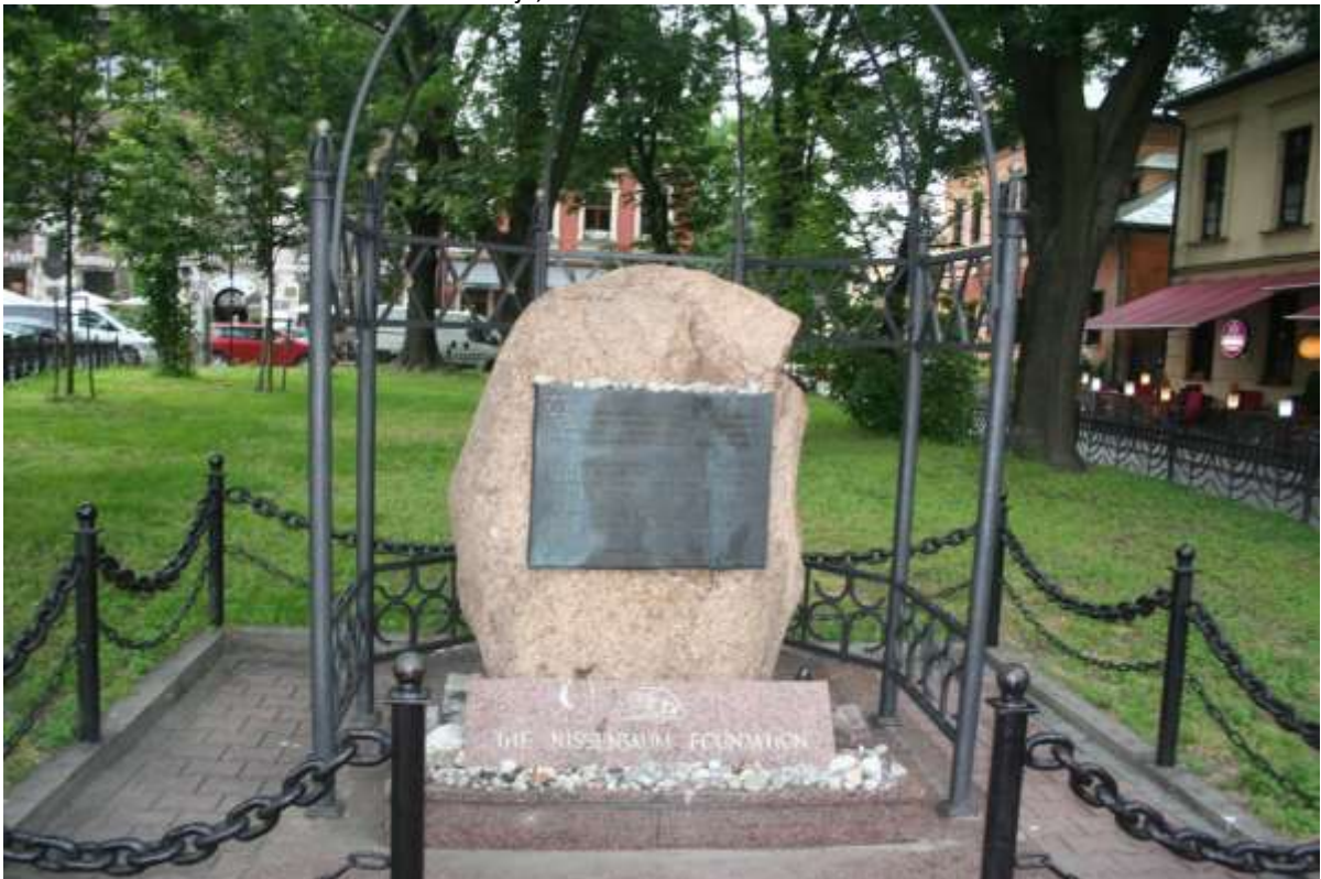
Herdenkingsplek voor de 65.000 vermoorde Joden door de Nazi's.