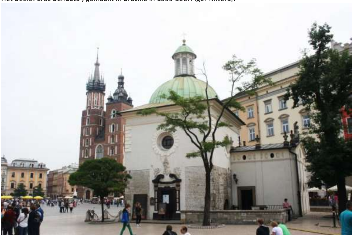
De 11e-eeuwse St. Wojciechkerkje.