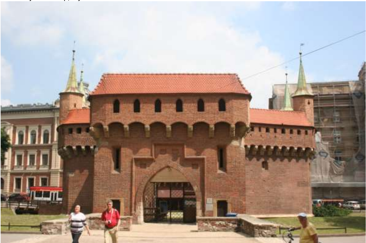
Eén van de voormalig poorten van Krakau, Barbacan, nu is er een museum in gevestigd.