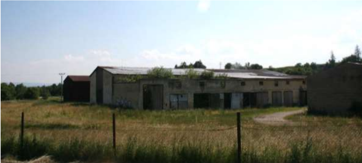
Een collectieve boerderij uit de communistische tijd in Stará Lesná in verval.