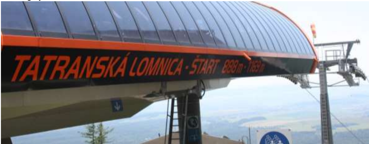
Het onderstation, het Tatranska Lomnica is de naam van het bergdorp.