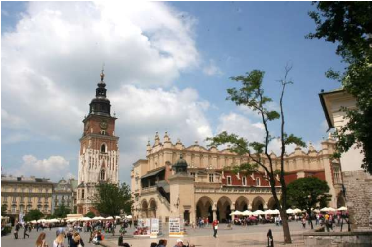
Raadhuistoren met de Lakenhal.