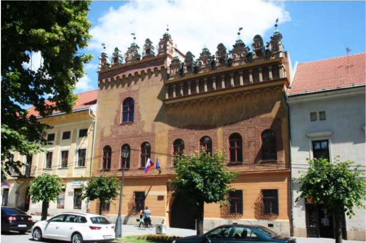
Een bijzonder huis in Levoca.