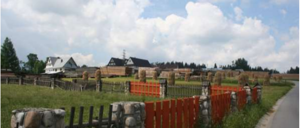
Landschap rond het dorpje Nowa Bystre.