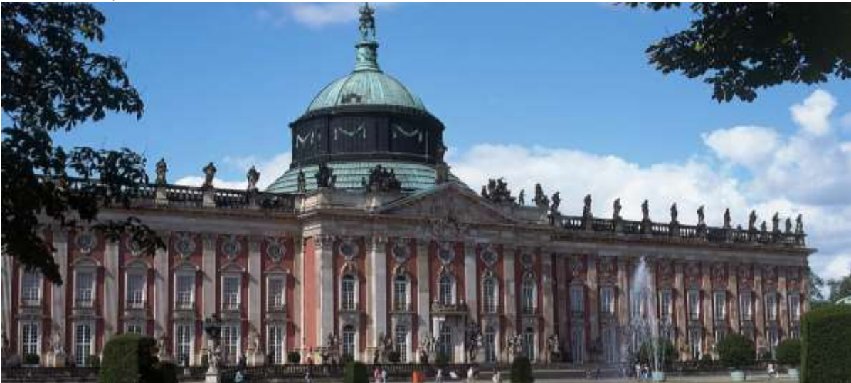
Het neue Palais.