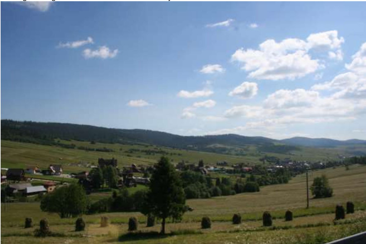
De Lage Tatra gezien vanaf de noordkant in Slowakije.