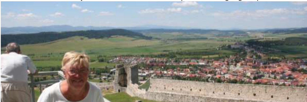
Marga met op de achtergrond het stadje Spišské Pohradie.