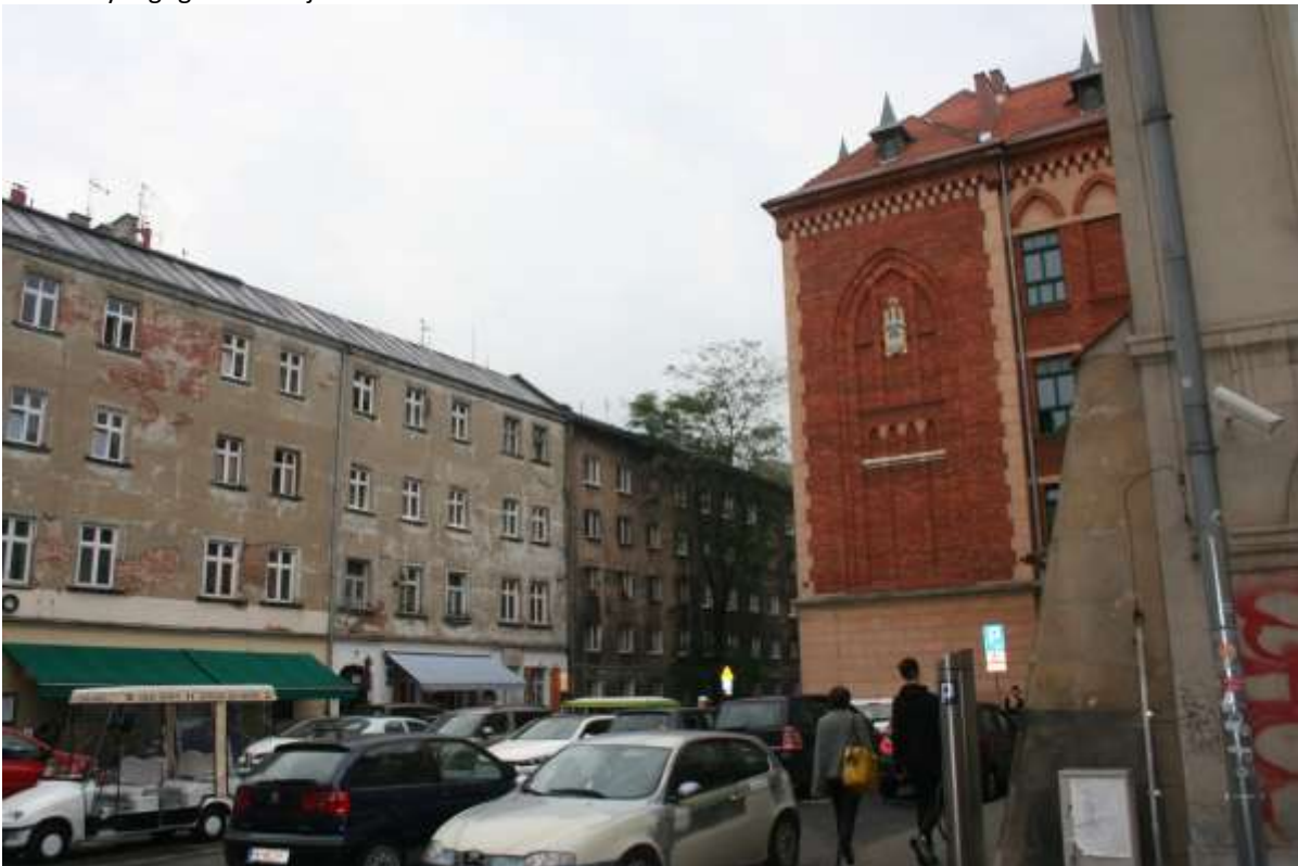
Een markt en straat in oostelijke gedeelte van Kazimierz.