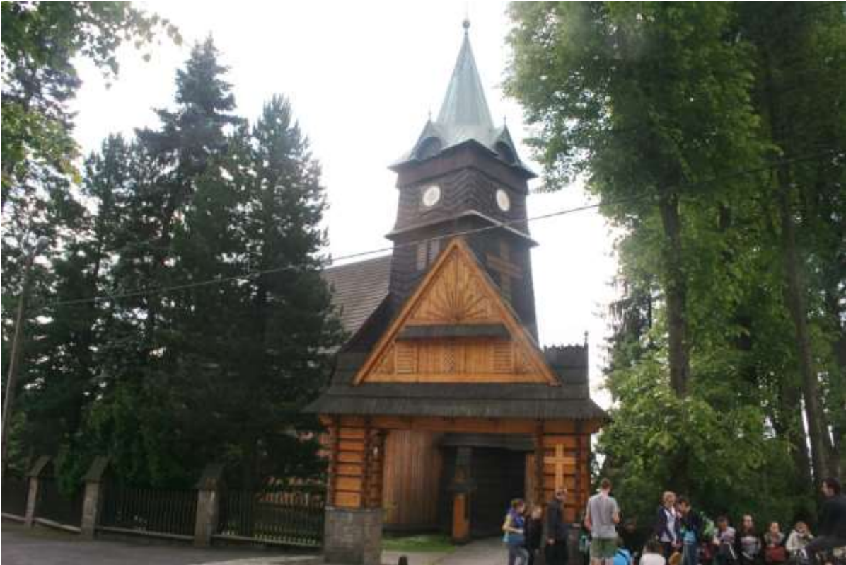
Een kerk in de buurt van Zakopane, het lichte gedeelte is de toegangspoort tot het kerkterrein.