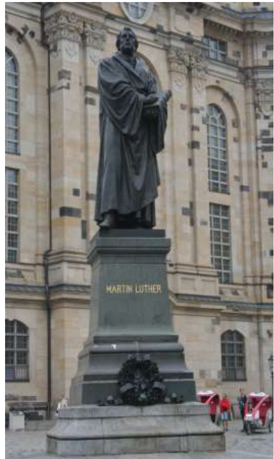
Martin Luther naast de Frauenkirche