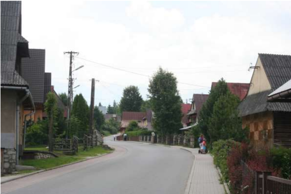
Bukowina Tartz, Hoofstraat.