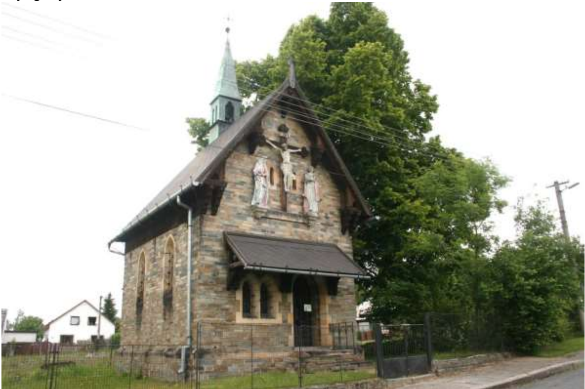
“Es ist Vollbracht”, staat boven onder de beelden op de kapel.