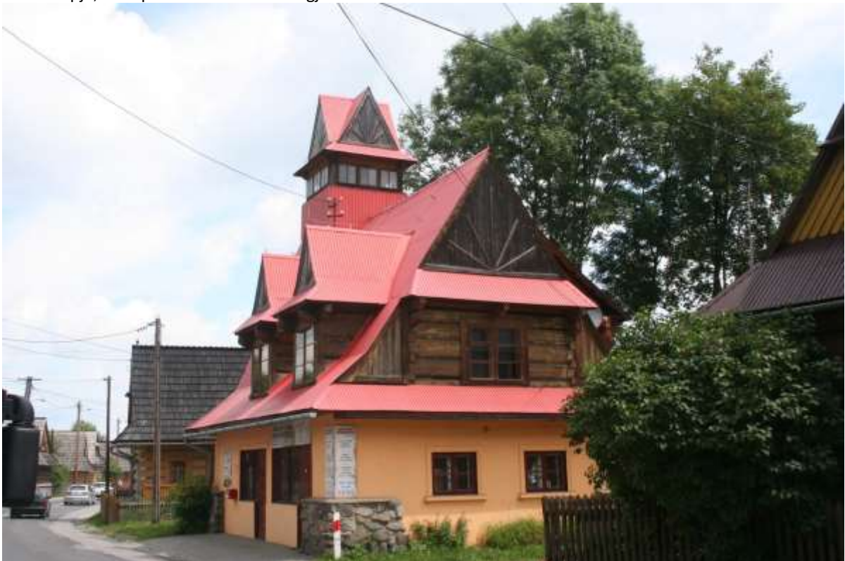
Een apart huis/gebouw in Chochołowska.