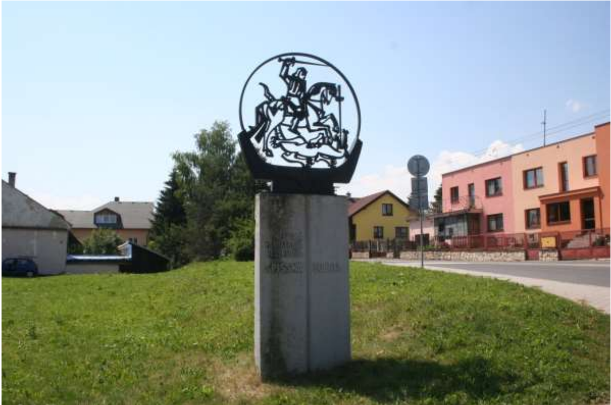
Beeld bij de ingang van Spisska Sobota