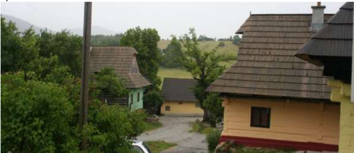
Hoofdstraat, het groene gebouw is de kerk.