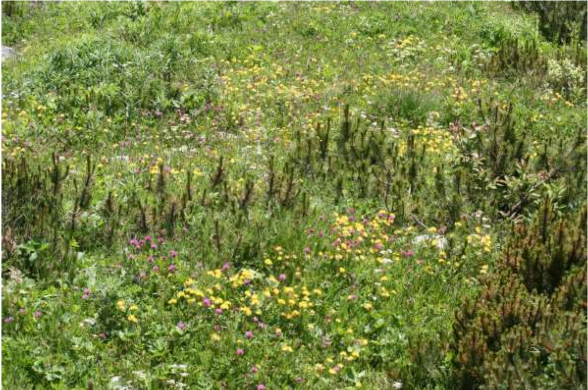
De bloemen op de berg.