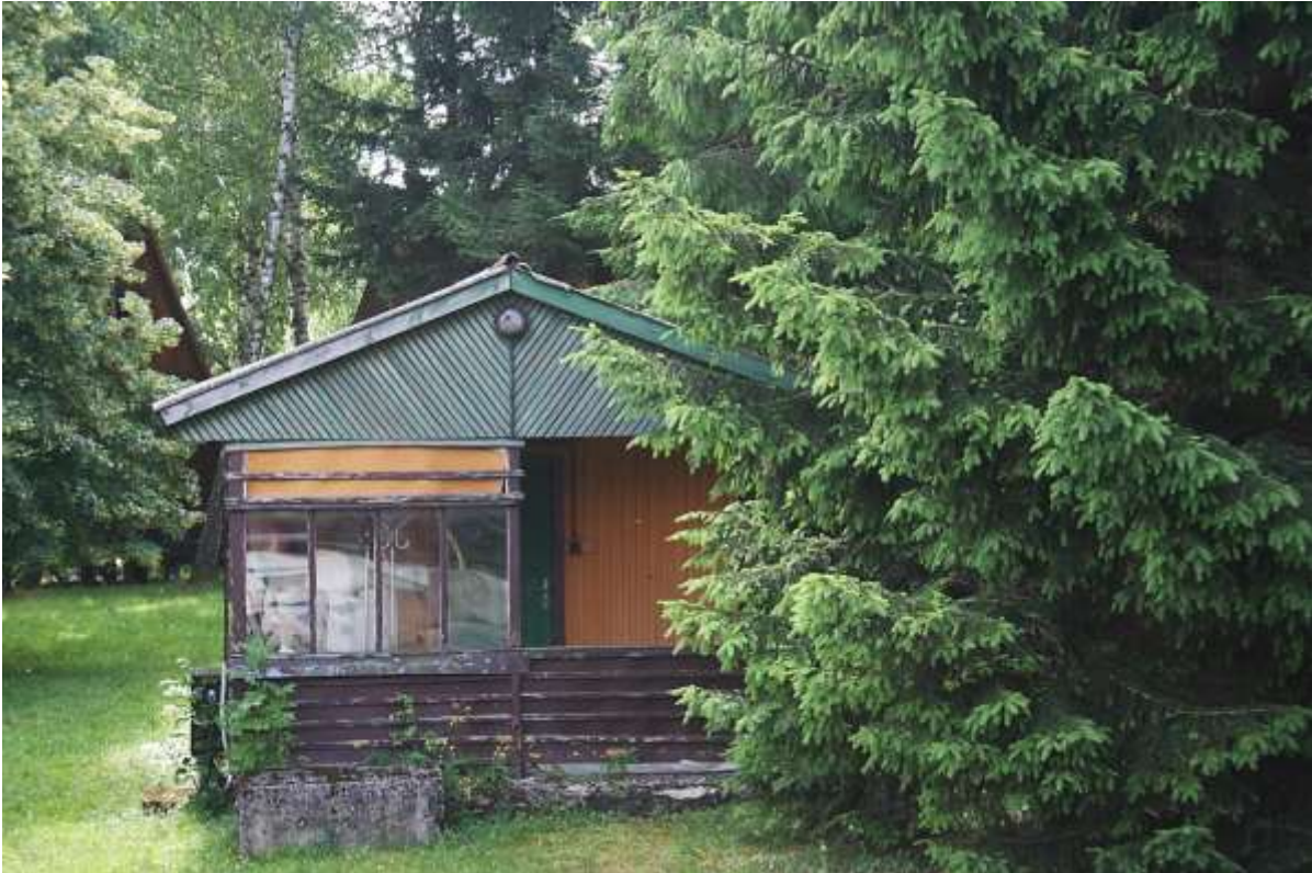
Een oud gebouwtje is in gebruik als opslagplaats.