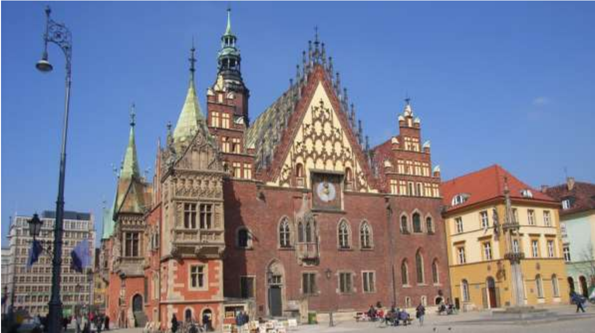
Het stadhuis, Wrocław.

Maandag 6 juli 2015. Stará Lesná-Wrocław.