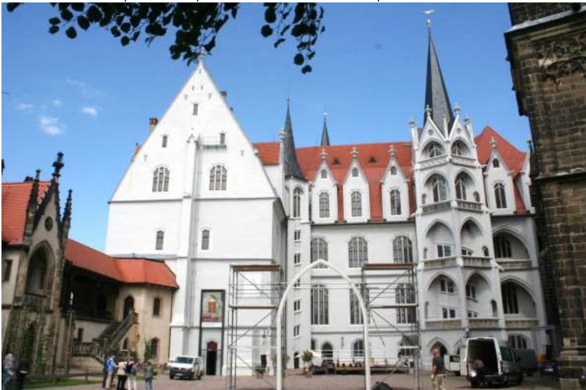
De burcht naast de Dom.