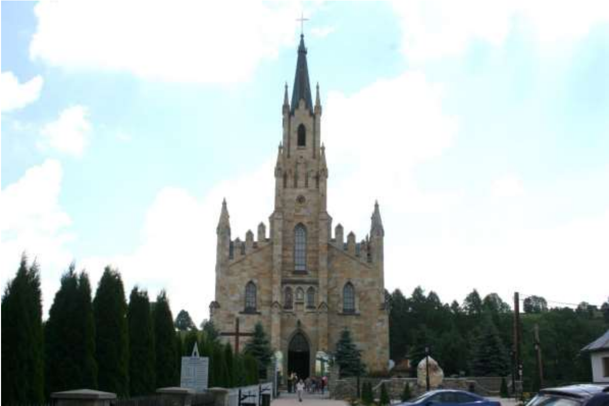
De kerk van Chochołowska