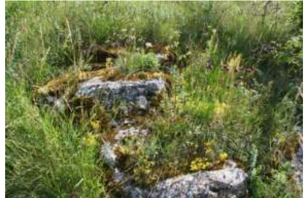
Bloemenpracht onderweg langs het pad.