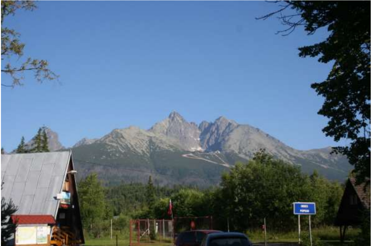
De berg Lomnický štít 2600 meter, vanaf de camping.