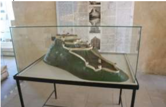
Maquette van het kasteelcomplex.