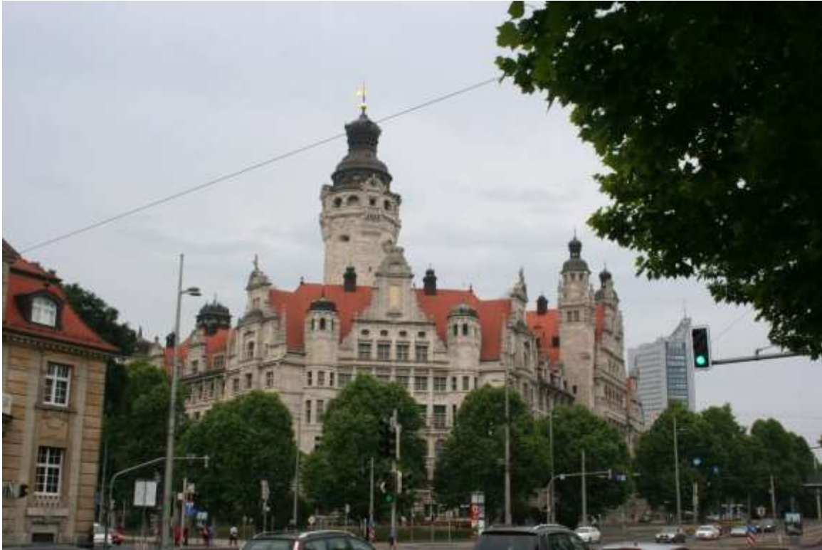
Het nieuwe Stadhuis met de bouw is begonnen in 1899.

Zaterdag 13 juni 2015 Clausthal-Zellerfeld – Leipzig.