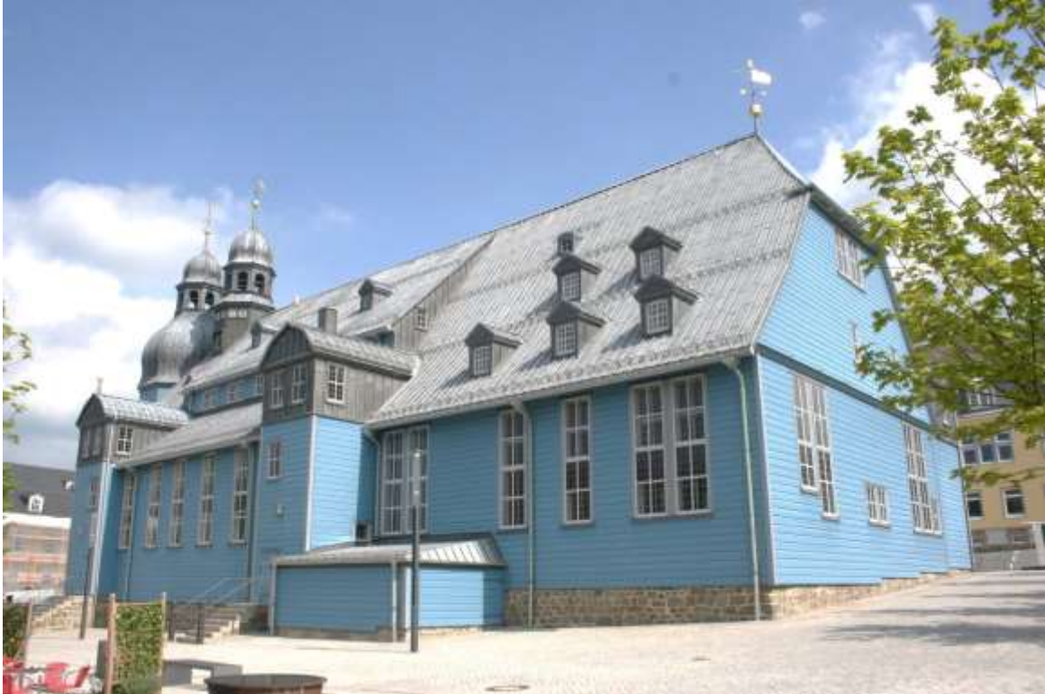
De Lutherse Marktkerk van de Heilige Geest, Clausthal.

Vrijdag 12 juni 2015 Clausthal-Zellerfeld.