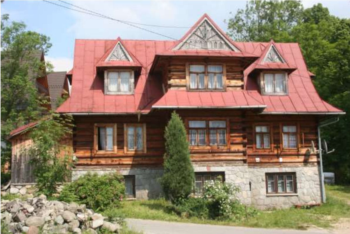
Woning tegenover de kerk.