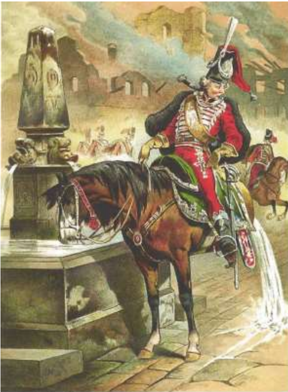
Verhalen van Baron van Munchausen.