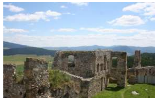
Een kijkje over de muren.