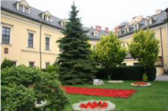
De tuinen op het binnenplein.