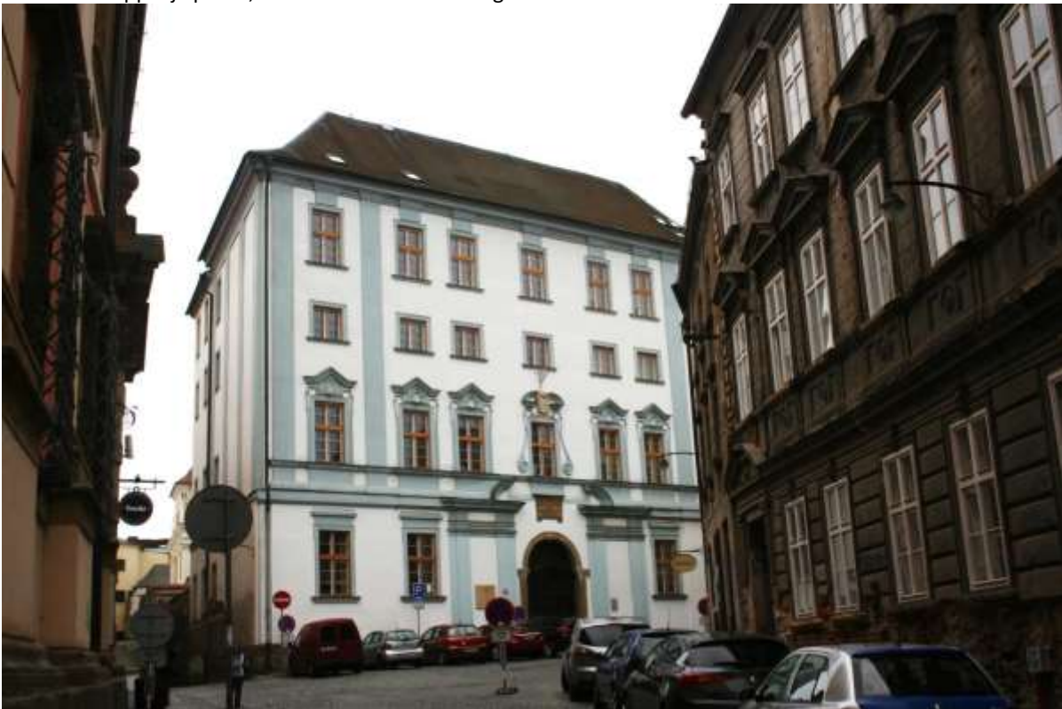
Een gebouw in een straat in Olomouc.