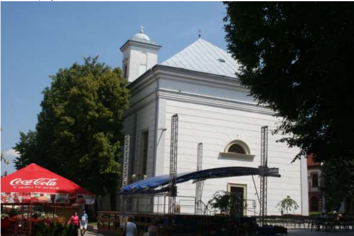
De Protestantse kerk, Poprad.