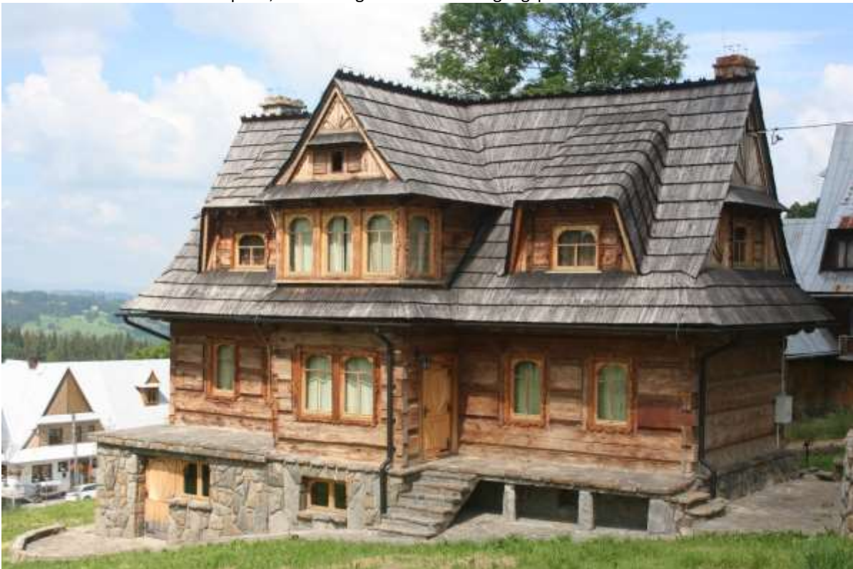
Huis ergens onderweg naar Chochołowska.