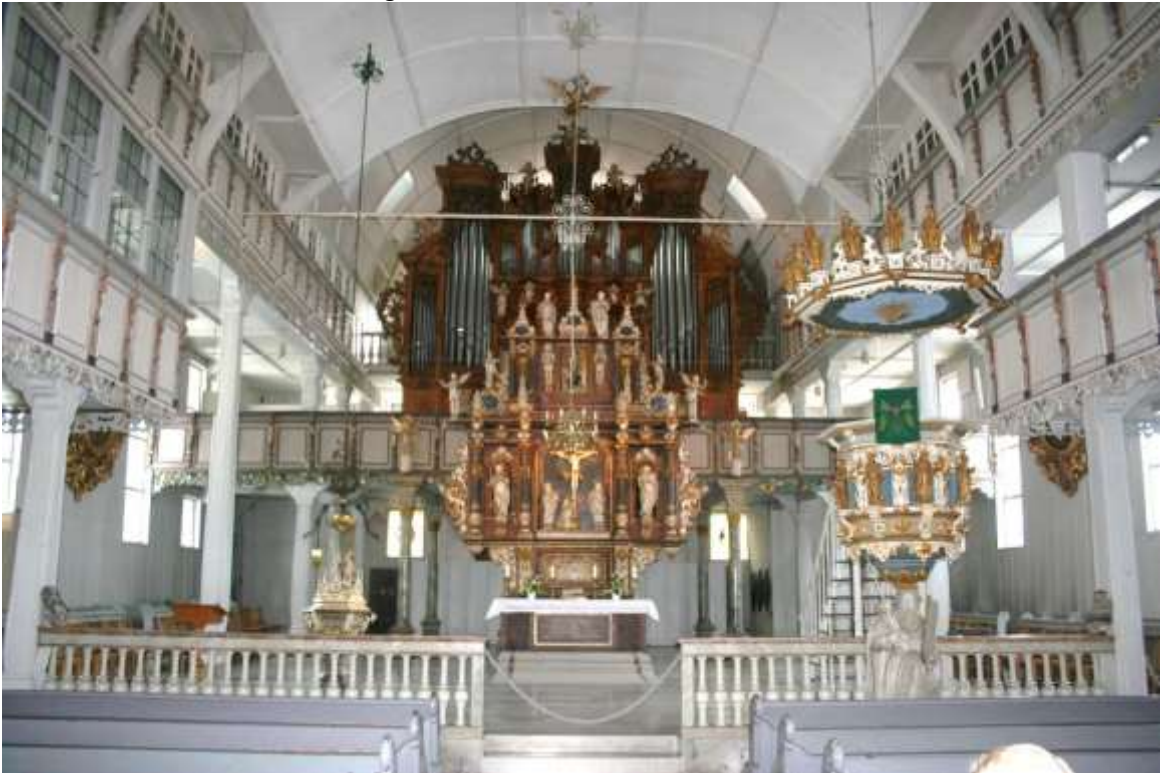
Het orgel, altaar en preekstoel.