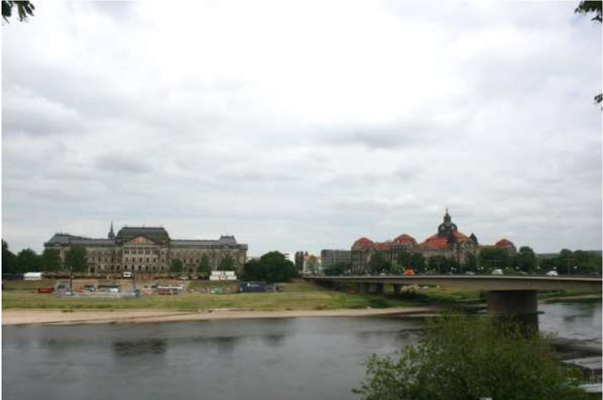
De rechteroever van de Elbe.

Maandag 15 juni 2015. Dresden (Kleinrörsdorf).