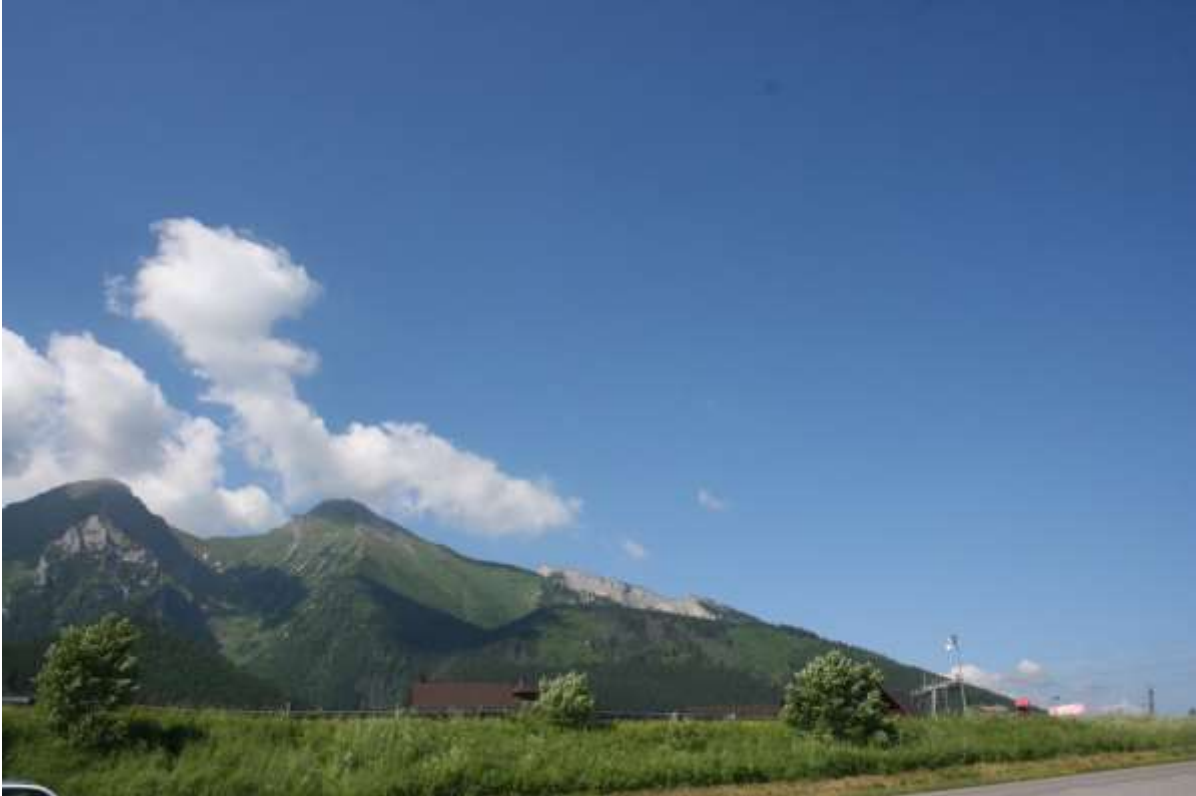
De Hoge Tatra gezien vanaf de zuidkant in Slowakije.

Donderdag 2 juli 2015. Zakopane – Stará Lesná. 59 km.