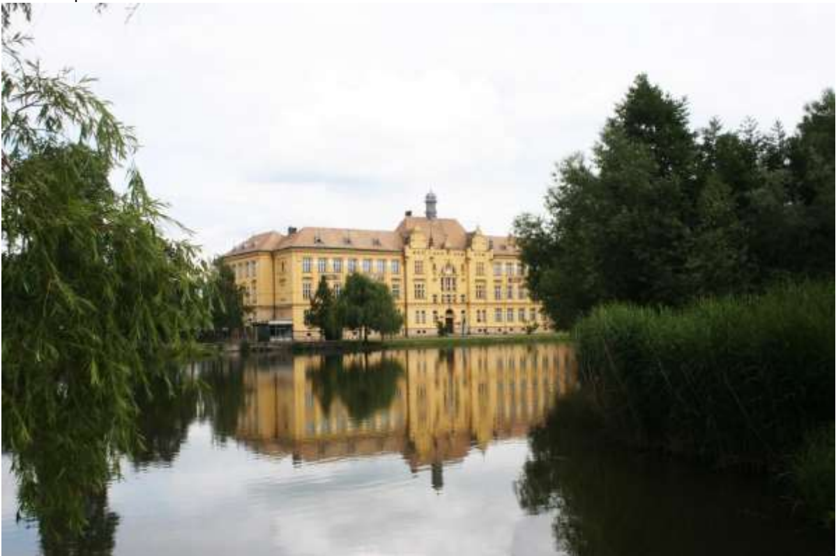
Gymnasium van Litovel.