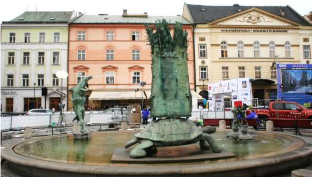
Fontein met verschillende dieren op het Stadhuisplein.