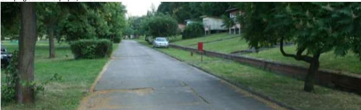
De voormalige atletiekbaan en camping huisjes op de camping.