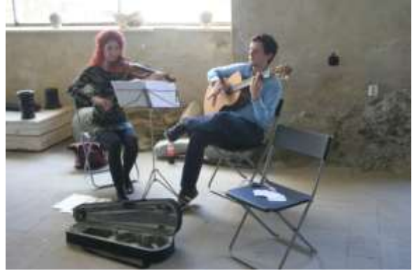
Ze speelden klassieke muziek.