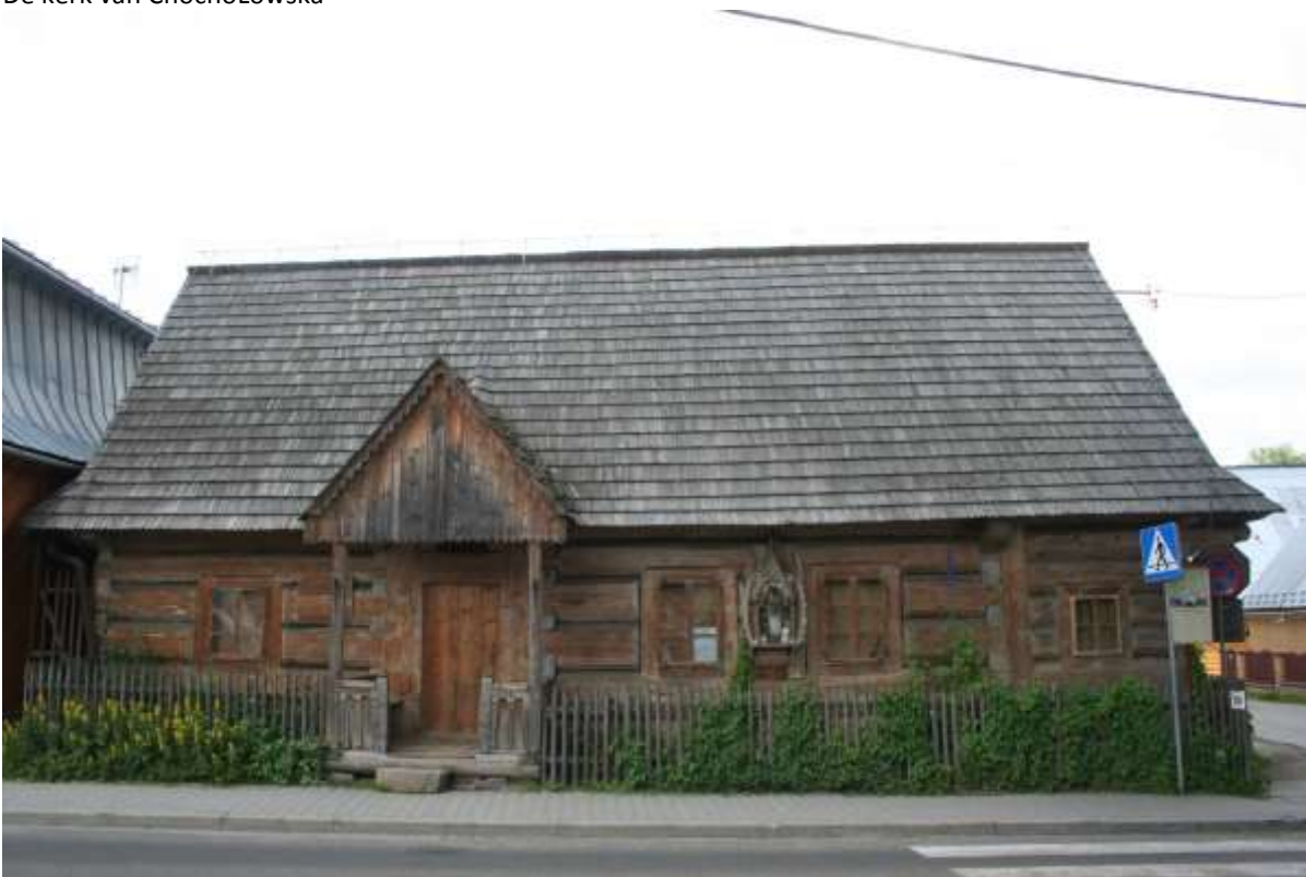
Huis tegenover de kerk in Chochołowska