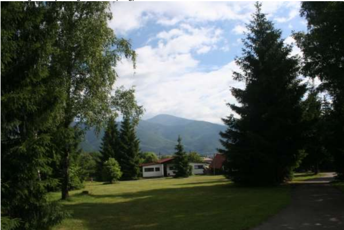
Uitzicht op de Lage Tatra, vanaf de Camping.